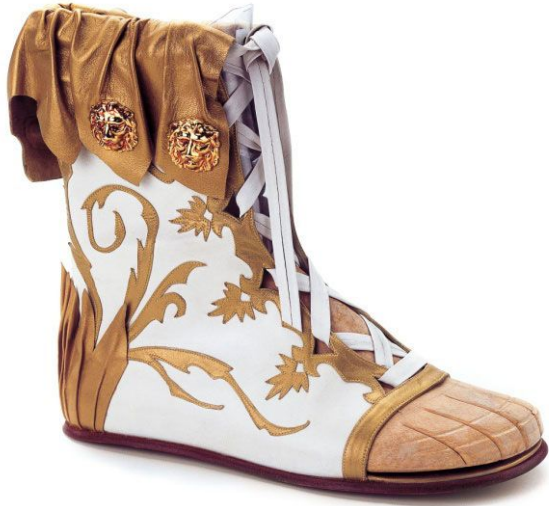
Botín griego. Museo del Calzado (Reproducción)

A partir del año 600 a.C., las mujeres griegas de la clase alta, adoptaron un calzado de cuero empleando pieles con los colores de moda que eran el blanco y el rojo. En los tiempos más antiguos apenas se empleaban calzados, iban descalzos y sólo posteriormente comenzaron a emplear zapatos, aunque en el interior de sus casas permanecían descalzos.