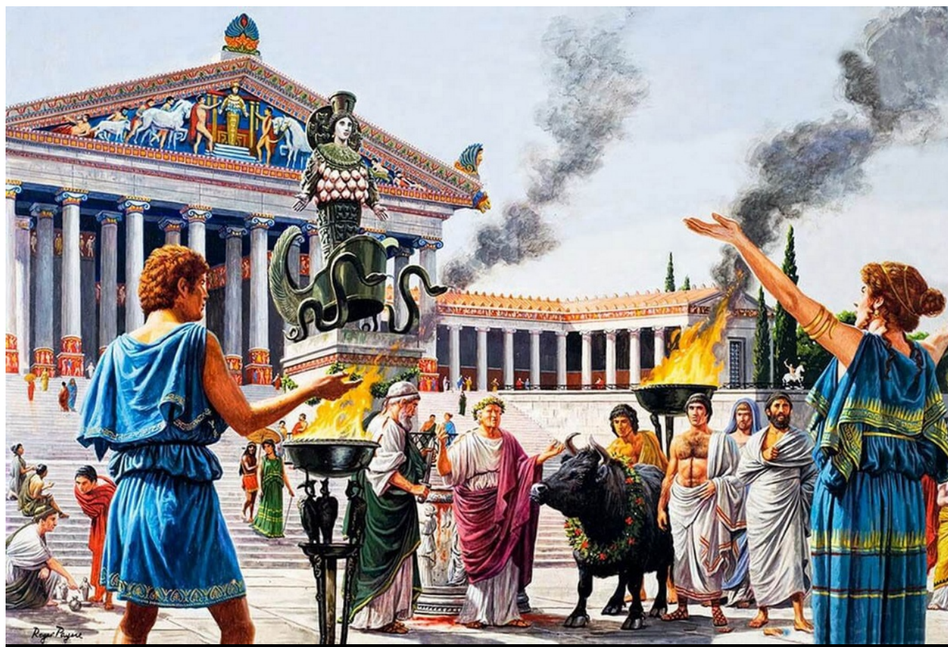
Rituales en la Grecia antigua.

Los griegos usaron la sandalia de cuero y la bota, para los hombres llegaba hasta la pantorrilla con aplicaciones de piezas metálicas, distinguían un quiebre diferente para el pie izquierdo y derecho.