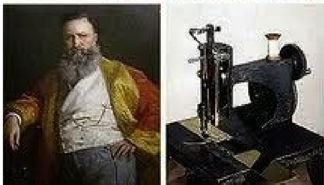
Arriba Elías Howe con su invención de máquina de coser. Abajo Isaac Merrit Singer fundador de la empresa SINGER.

La máquina de coser más conocida de aquellos años y la que más se comercializó y vendió fue, en 1845 , la de Eliás Howe que realizaba 200 puntos por minuto y hacía punto de cadeneta.