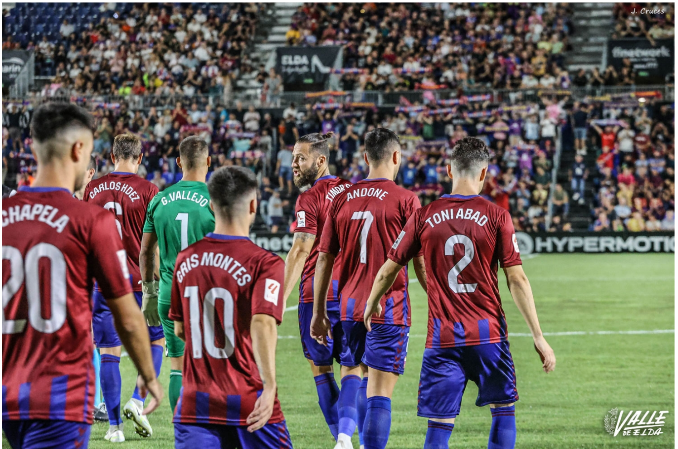
Los jugadores del Eldense ya piensan en su primera visita al RCD Espanyol de Barcelona

El mundo es un pañuelo. Hace casi 123 años se fundó el Real Club Deportivo Español de Barcelona. Fue el 28 de octubre de 1900 por medio de varios estudiantes de la Universidad de la Ciudad Condal. En sus orígenes el equipo barcelonés vistió de amarillo y a partir de 1909 comenzó a lucir los colores blanquiazules.