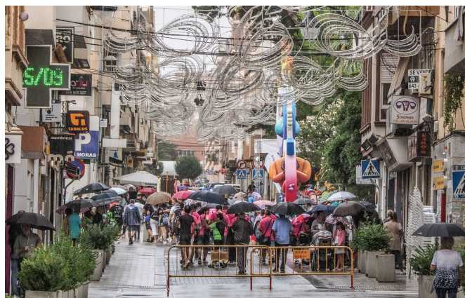
A pesar de que la mañana ha estado pasada por agua, la lluvia

esperado después de dos años de ausencia por la pandemia.