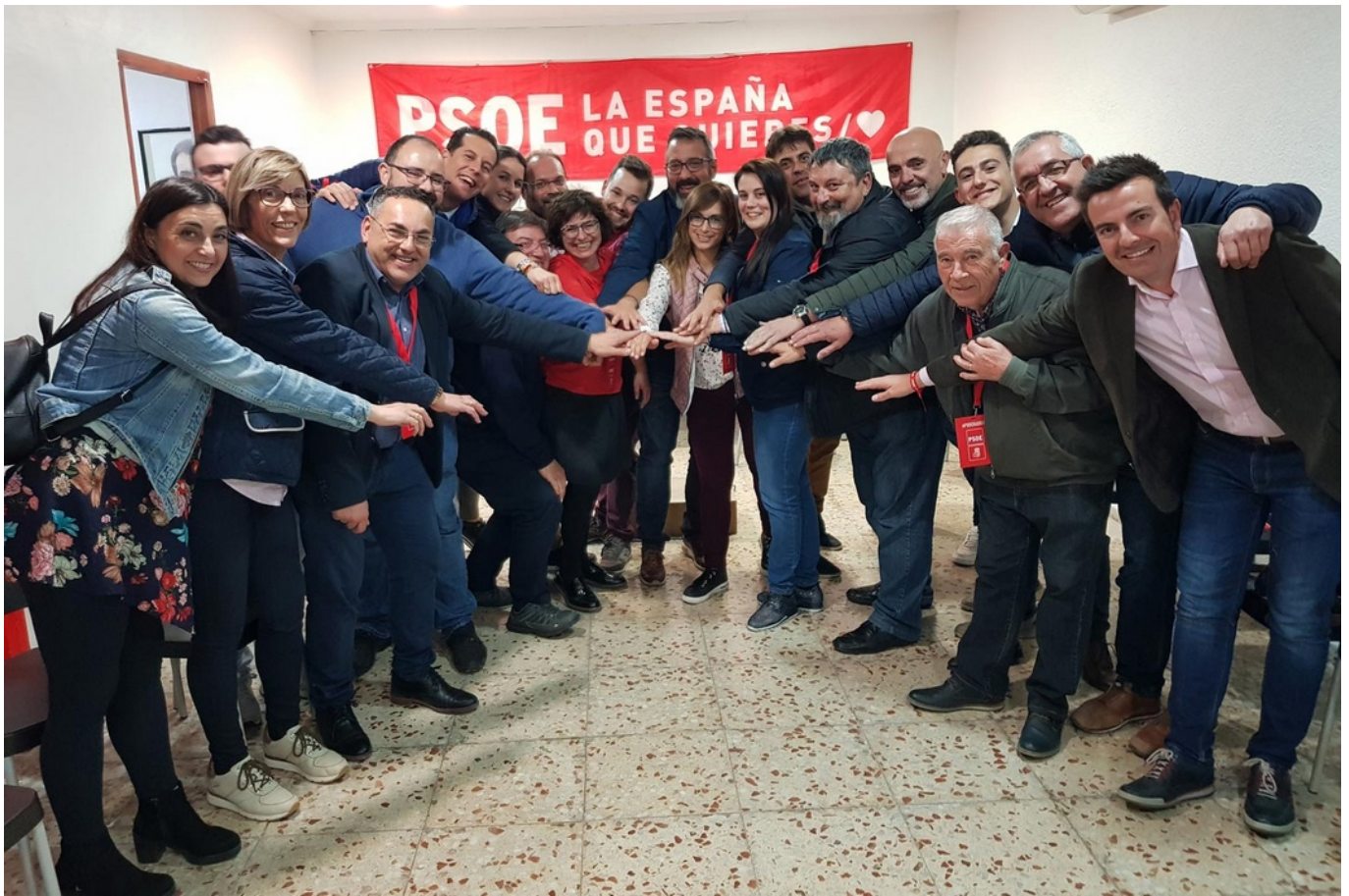
El PSOE celebrando la victoria de su partido.

Los eldenses han votado en su mayoría al PSOE en las elecciones generales al Congreso siguiendo la tónica general del resto del país, con casi un 31 por ciento de los votos . El PSOE vuelve así a ganar en unas elecciones generales en Elda 30 años después, pues su última victoria fue en el 89. Una de las sorpresas es que Ciudadanos se coloca en segundo lugar (21% de los votos), adelantando al PP (16%). El PP pasa así a ser al tercer partido más votado , seguido de cerca por Podemos (15%). Vox irrumpe con un 10% de los votos . Por otra parte, el PSOE de Ximo Puig ha sido la fuerza más votada en las elecciones autonómicas celebradas