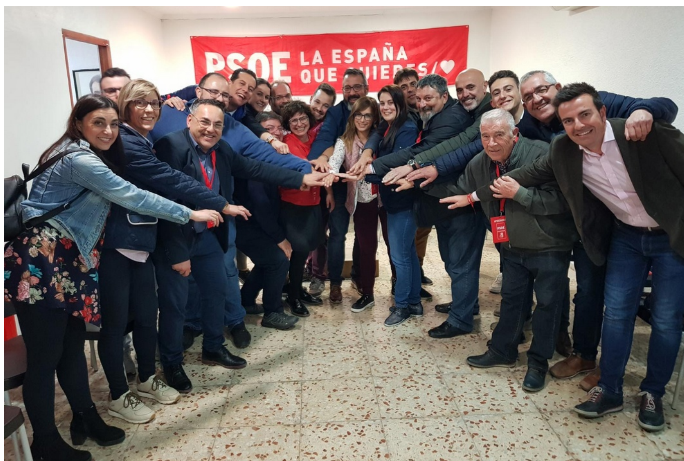
El PSOE celebrando la victoria de su partido.

Los eldenses han votado en su mayoría al PSOE en las elecciones generales al Congreso siguiendo la tónica general del resto del país, con casi un 31 por ciento de los votos . El PSOE vuelve así a ganar en unas elecciones generales en Elda 30 años después, pues su última victoria fue en el 89. Una de las sorpresas es que Ciudadanos se coloca en segundo lugar (21% de los votos), adelantando al PP (16%). El PP pasa así a ser al tercer partido más votado , seguido de cerca por Podemos (15%). Vox irrumpe con un 10% de los votos . Por otra parte, el PSOE de Ximo Puig ha sido la fuerza más votada en las elecciones autonómicas celebradas