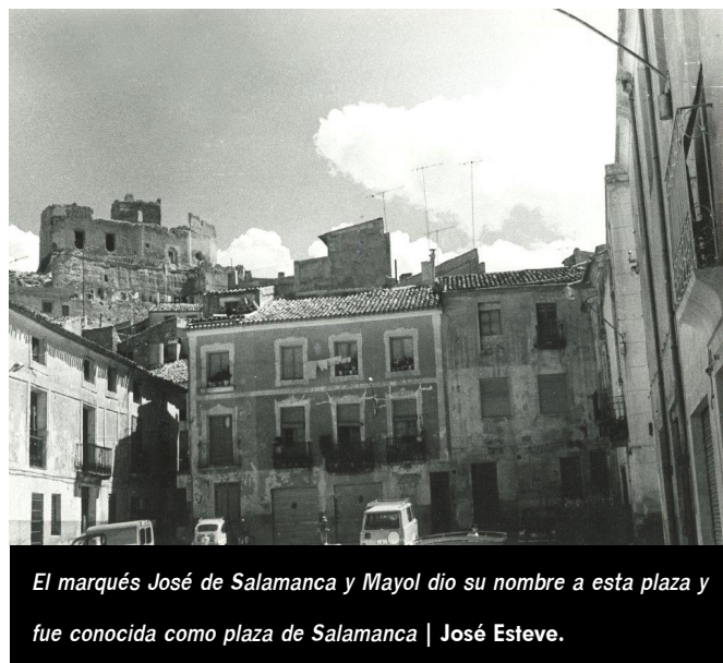
El marqués José de Salamanca y Mayol dio su nombre a esta plaza y fue conocida como plaza de Salamanca | José Esteve.

proteger los árboles que se habían plantado.