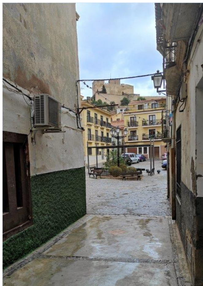
Tras la entrada de los ayuntamientos democráticos, en 1979, se cambió la antigua denominación de plaza Primo de Rivera por la de plaça de Dalt. Año 2021