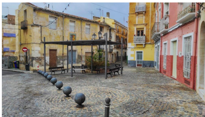
Durante la República fue la plaza de la Libertad. Año 2021 | Pascual Maestre.

En la primera sesión plenaria del gobierno provisional de la República, celebrada por el Ayuntamiento de Petrer el día 15 de abril de 1931 , entre los acuerdos que se tomaron se decidió cambiar el nombre de Primo de Rivera por plaza de la Libertad . Tras la Guerra Civil se volvió a rotular como Primo de Rivera, nombre que perduró hasta 1979.