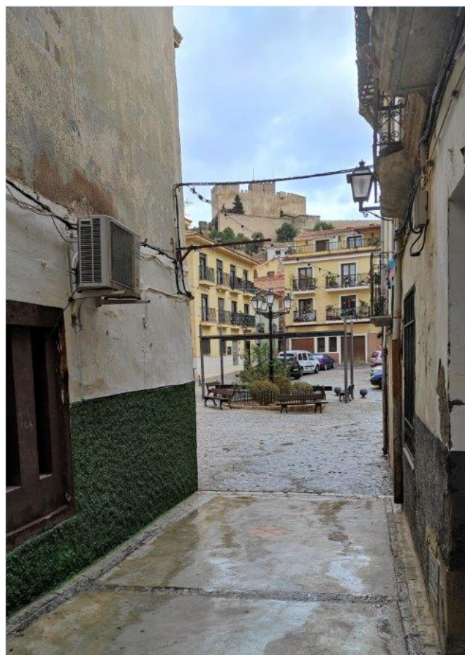
Tras la entrada de los ayuntamientos democráticos, en 1979, se cambió la antigua denominación de plaza Primo de Rivera por la de plaça de Dalt.