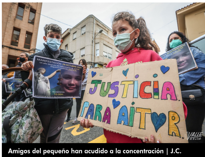
Amigos del pequeño han acudido a la concentración | J.C.

La madre ha convocado a la población esta tarde a las 20 horas en la puerta del Centro de Salud II para acompañarla durante una vigilia en la que colocarán velas en recuerdo del pequeño.