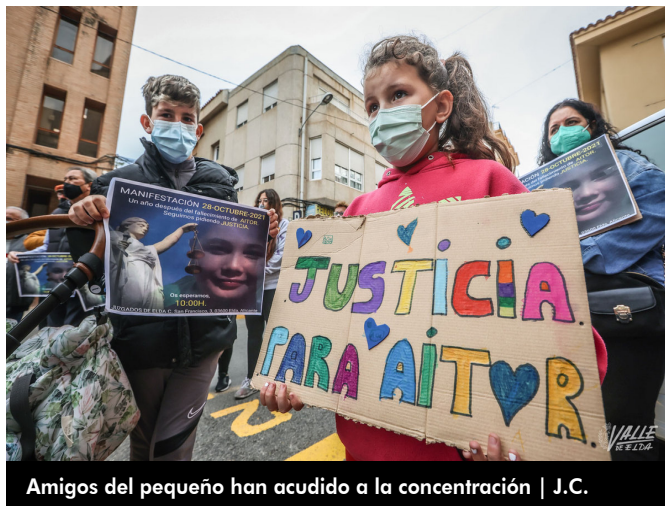
Amigos del pequeño han acudido a la concentración

La madre ha convocado a la población esta tarde a las 20 horas en la puerta del Centro de Salud II para acompañarla durante una vigilia en la que colocarán velas en recuerdo del pequeño.