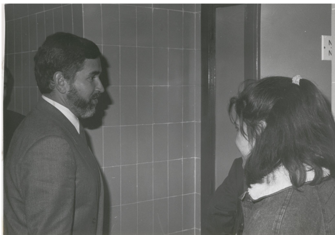
El presidente de la Generalitat, Joan Lerma inauguró el colegio el 17 de diciembre de 1988.

Como es lógico suponer, cada colegio de Petrer tiene su propia historia y su propia vida. En esta ocasión conmemoramos el 34 aniversario de la inauguración del CEIP Reina Sofía, el Reina, como nos gusta llamarlo. Cumplir años siempre es motivo de alegría porque significa que estamos vivos y avanzamos. Esta conmemoración supuso un doble motivo de celebración. Por una parte, porque este colegio que, como ya hemos indicado, inició su andadura educativa en 1988, ha dado ya varias promociones de universitarios que iniciaron su formación en sus aulas y que ya ejercen sus profesiones. Pero cuando hablamos de enseñanza no sólo nos referimos a ella en el sentido estricto de la palabra, sino a la educación y a la formación con mayúsculas, esa que transmiten los maestros junto a los valores vitales que nos dan nuestros padres, para que seamos personas de bien a lo largo de toda nuestra vida. El segundo motivo de satisfacción es porque es el colegio más joven de Petrer -teniendo en cuenta que el 9 d'Octubre sustituyó al que siempre conocimos como el Primo: el Primo de Rivera-, y como centro educativo con 34 años está más vivo y dinámico cada día que pasa.