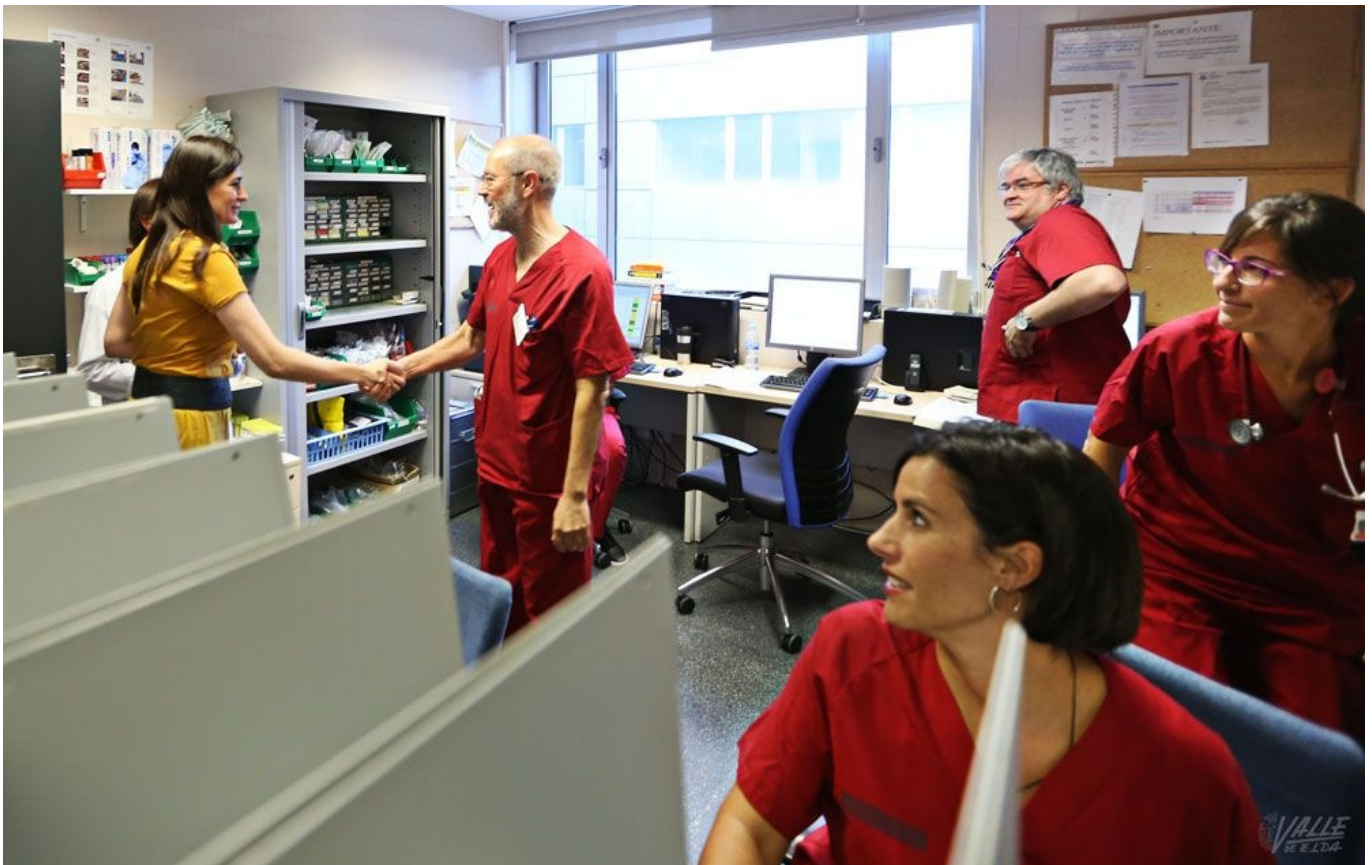
El departamento de salud de Elda acaba de publicar su memoria anual de 2016 | Jesús Cruces

El Departamento de Salud de Elda ha publicado su Memoria Anual del año 2016, que muestra de manera detallada el total de gastos, así como el número de consultas e intervenciones realizadas. Según la Memoria, en el departamento trabajan más de dos mil personas, como médicos (495), enfermeros (659) y auxiliares (419) y médicos o enfermeras que están realizando sus prácticas como internos residentes (72), entre otros. En el área de salud, que abarca desde Biar hasta Pinoso, incluyendo Elda, Petrer, Villena y Novelda, se han realizado inversiones por un valor cercano a los dos millones de euros (1.863.786), cifra que casi duplica la del pasado año, si bien el montante más elevado es