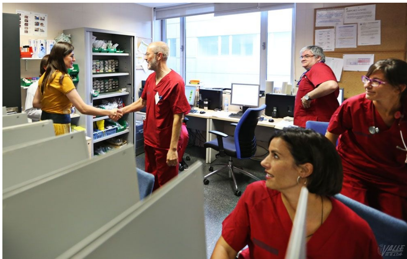
El departamento de salud de Elda acaba de publicar su memoria anual de 2016 | Jesús Cruces

El Departamento de Salud de Elda ha publicado su Memoria Anual del año 2016 , que muestra de manera detallada el total de gastos, así como el número de consultas e intervenciones realizadas. Según la Memoria, en el departamento trabajan más de dos mil personas, como médicos (495), enfermeros (659) y auxiliares (419) y médicos o enfermeras que están realizando sus prácticas como internos residentes (72), entre otros. En el área de salud, que abarca desde Biar hasta Pinoso, incluyendo Elda, Petrer, Villena y Novelda, se han realizado inversiones por un valor cercano a los dos millones de euros (1.863.786), cifra que casi duplica la del pasado año, si bien el montante más elevado es