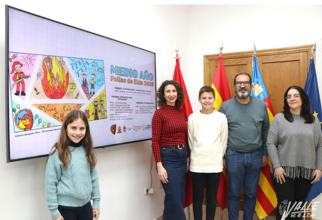
Edurne Busquier ha creado el cartel promocional | Marta Maestre.

Por último, el domingo a las 12 horas se realizará el homenaje a los falleros fallecidos en la Rotonda de las Fallas, frente al Mercado Central. Continuarán con el Desfile del Medio Año y concluirá con la cremá de la falla en el Alminar.