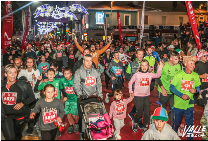
La población disfrutó al máximo de la última tarde del 2023

En esta ocasión, la prueba volvió a su itinerario habitual de 3.750 metros de recorrido con salida y meta en la Plaza Castelar y se recuperó el chip, lo que hizo más sencillo llevar un control de los atletas en meta. Además, ayudó a evitar aglomeraciones a la llegada.