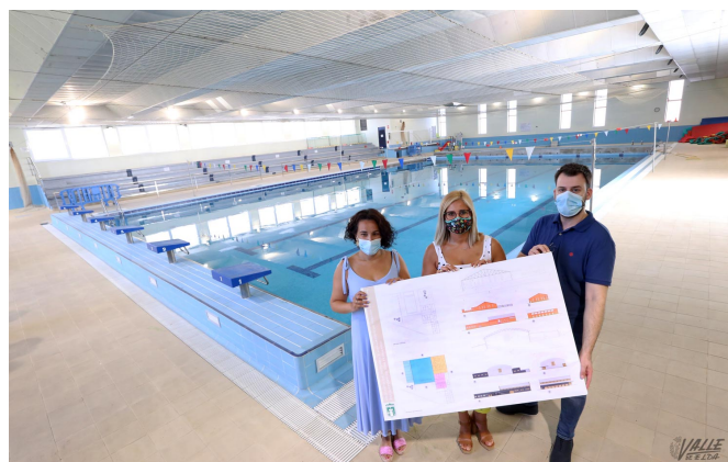
La Diputación de Alicante ha subvencionado parte de las obras