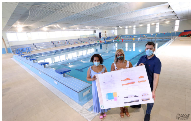
La Diputación de Alicante ha subvencionado parte de las obras