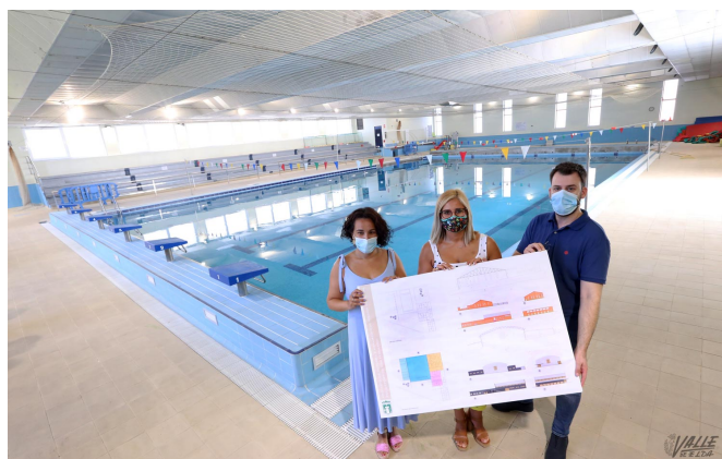
La Diputación de Alicante ha subvencionado parte de las obras