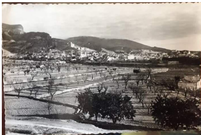
En la fotografía en blanco y negro se aprecia la superficie sobre la que se construyó el centro comercial en una imagen tomada en 1951.

La implantación, por primera vez en Petrer, de una superficie comercial de estas dimensiones levantó lógicos temores en el sector del comercio local, sensación que contrastaba con el sentimiento de orgullo que tenían muchos petrerenes por disponer de un servicio de estas características que situaba a Petrer como referencia comarcal a nivel comercial.