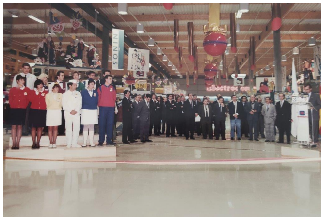
Las autoridades recorrieron el recinto comercial.

Entre otras contraprestaciones Continente construyó un nuevo campo de fútbol sustituyendo al que había y que además contaría con pista de atletismo.