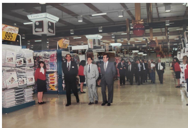
La inauguración de Continente tuvo gran repercusión

La inversión superó los mil quinientos millones de las antiguas pesetas y la decisión de los responsables de la multinacional Continente de instalarse en nuestra población fue un bombazo. Gracias a las compensaciones urbanísticas el entorno del casco urbano experimentó una transformación muy importante sin ningún costo para las arcas municipales. La zona del Guirney cambió totalmente su aspecto y Petrer y Elda estuvieron mucho más cerca gracias a la prolongación de la avenida Reina Sofía que enlazó con la Gran Avenida de la vecina población. Sin olvidar los numerosos puestos de trabajo que se crearon y la importancia comercial que se le dio al municipio.