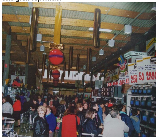
Imagen de una de las secciones del hipermercado con los precios puestos en pesetas.

Hasta aquí una breve historia de este centro comercial que tuvo gran repercusión tanto a nivel mediático como en lo que se refiere a la vida comercial de nuestro pueblo. Hace ahora treinta años Petrer se convirtió en una ciudad moderna y en un referente comercial para los pueblos vecinos gracias a la instalación de este gran superficie.