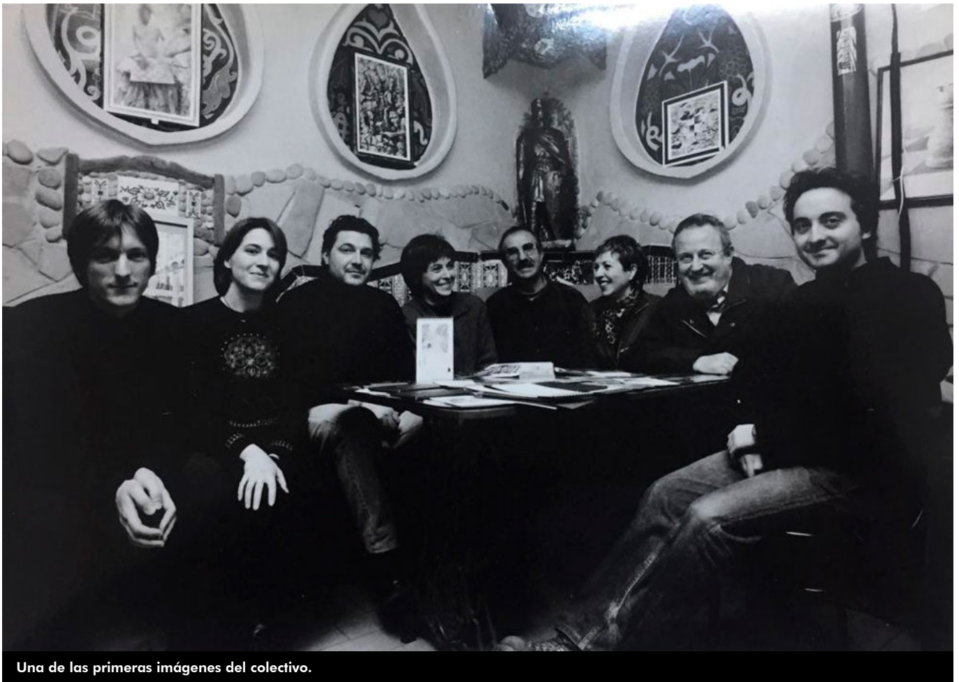
Una de las primeras imágenes del colectivo.

El grupo de artistas plásticos EIDado celebra su 20º aniversario con una exposición en el Museo del Calzado, abierta hasta el 28 de enero. Se trata de una interesante muestra en la que sus componentes han recreado una parte de sus estudios como su lugar de trabajo . Todos estos artistas tienen un común el interés por la interacción de su arte, el compromiso social, la renuncia al mercantilismo económico y su apuesta por las vanguardias .