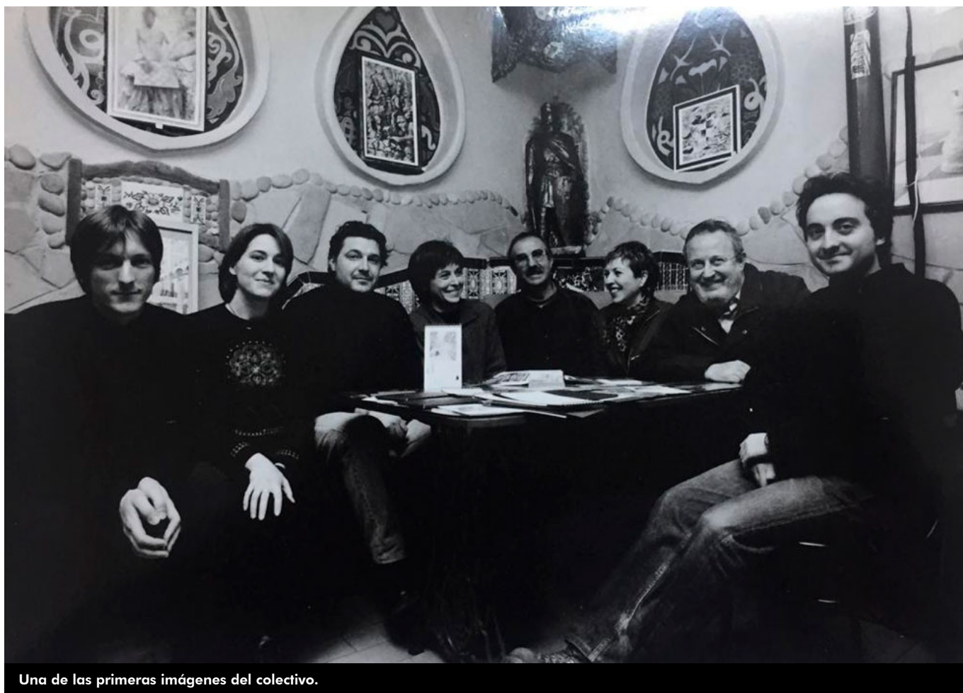
Una de las primeras imágenes del colectivo.

El grupo de artistas plásticos EIDado celebra su 20º aniversario con una exposición en el Museo del Calzado, abierta hasta el 28 de enero. Se trata de una interesante muestra en la que sus componentes han recreado una parte de sus estudios como su lugar de trabajo . Todos estos artistas tienen un común el interés por la interacción de su arte, el compromiso social, la renuncia al mercantilismo económico y su apuesta por las vanguardias .