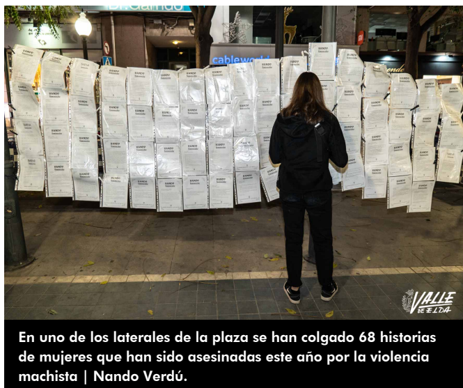
En uno de los laterales de la plaza se han colgado 68 historias de mujeres que han sido asesinadas este año por la violencia machista | Nando Verdú.

Alrededor de las 20:10 horas ha arrancado el acto con el manifiesto en el que se ha recordado a Ana Orantes , quien dos semanas después de decir en un programa de televisión que sufría violencia por parte de su exmarido, fue asesinada. Otro de los datos que se han dado durante el manifiesto es que "desde el año 2003 , momento en el que se empezó a contabilizar las mujeres que morían a manos de sus parejas, un total de 1.171 mujeres han sido asesinadas , y este dato es sin