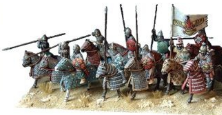
Soldados persas en batalla y la caballería protegida con fuertes armaduras

Los persas o farsies fueron un grupo étnico que habitó Irán , Afganistán y Tayikistán. También el pueblo persa, 1400 a.C. nos han legado algunas representaciones de personajes con calzados. Los jarrones de cerámica, las esculturas y los grabados de la época evocan un tipo de calzado característico. El calzado de los persas seguía las mismas pautas que el del pueblo Asirio, es decir, los soldados llevaban un tipo de calzado de piel. Para lo que llamaríamos "la infantería", esos guerreros que se movían a pie de un sitio a otro, el calzado era sencillo, flexible y ligero. Pero los soldados a caballo calzaban botas, en algunos casos con polainas, alcanzando gran celebridad los arqueros a caballo. El pueblo que se dedicaba a las faenas agrícolas iban descalzos o empleaban un calzado hecho de fibras vegetales.