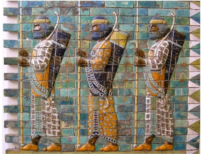
Friso llamado de los inmortales que presenta arqueros persas con sencillos calzados

La mujer que empleaba túnicas y velos, usaba unos sencillos zapatos de tela o cuero con adornos de oro y cintas atadas al pie o pierna.