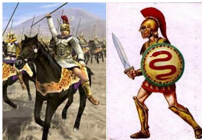
Guerrero de caballería persa y soldado de tropa de choque a pie

Los persas o farsies fueron un grupo étnico que habitó Irán , Afganistán y Tayikistán. También el pueblo persa, 1400 a.C. nos han legado algunas representaciones de personajes con calzados. Los jarrones de cerámica, las esculturas y los grabados de la época evocan un tipo de calzado característico. El calzado de los persas seguía las mismas pautas que el del pueblo Asirio, es decir, los soldados llevaban un tipo de calzado de piel. Para lo que llamaríamos "la infantería", esos guerreros que se movían a pie de un sitio a otro, el calzado era sencillo, flexible y ligero. Pero los soldados a caballo calzaban botas, en algunos casos con polainas, alcanzando gran celebridad los arqueros a caballo. El pueblo que se dedicaba a las faenas agrícolas iban descalzos o empleaban un calzado hecho de fibras vegetales.