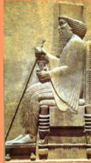
Yo soy Darío, el gran rey

Por el color del calzado también se diferenciaban las clases: pasaban del amarillo para los poderosos, al cuero con curtimiento vegetal y las fibras vegetales para los más humildes.