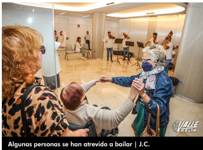
Algunas personas se han atrevido a bailar | J.C.

El hospital ha contado con dúos de violonchelos, cuartetos de cuerda, percusión, sextetos de viento repartidos por todas las secciones. Además, algunos de los pacientes se han lanzado a bailar como ha ocurrido en oncología donde la música ha traído la alegría, a la vez que algunas personas se han emocionado escuchando la música.