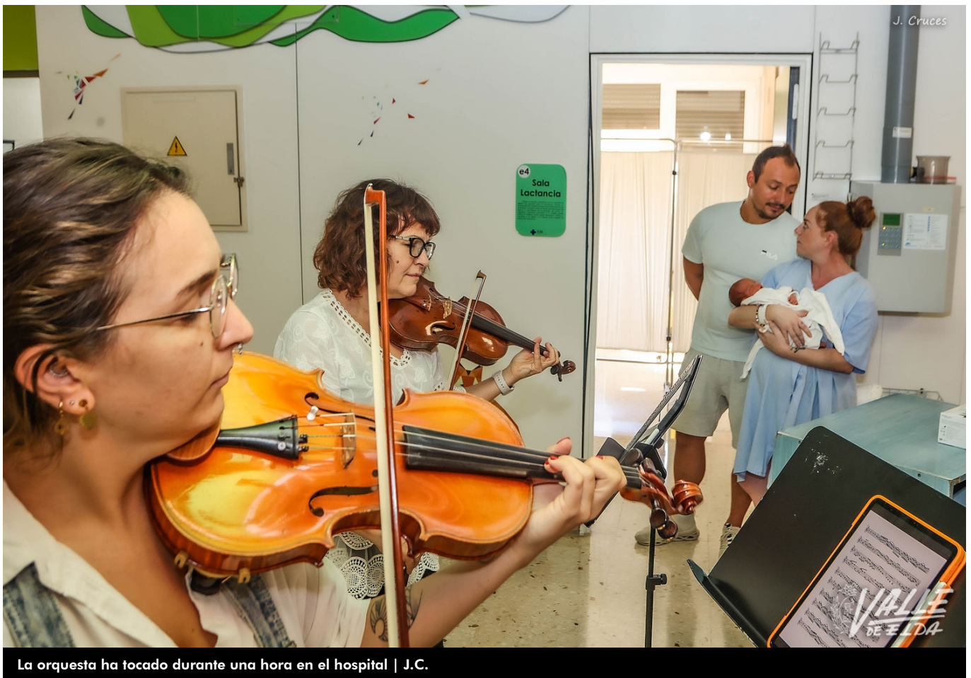
La orquesta ha tocado durante una hora en el hospital

La Orquesta ADDA Sinfónica ha actuado en el Hospital General Universitario de Elda durante una hora, de 11 a 12 horas, rompiendo así la rutina y llevando la alegría tanto a pacientes como a profesionales. El evento ha contado con más de 50 músicos que han tocado todo tipo de piezas con obras desde Beethoven hasta Queen o incluso Luis Fonsi con su "Despacito".