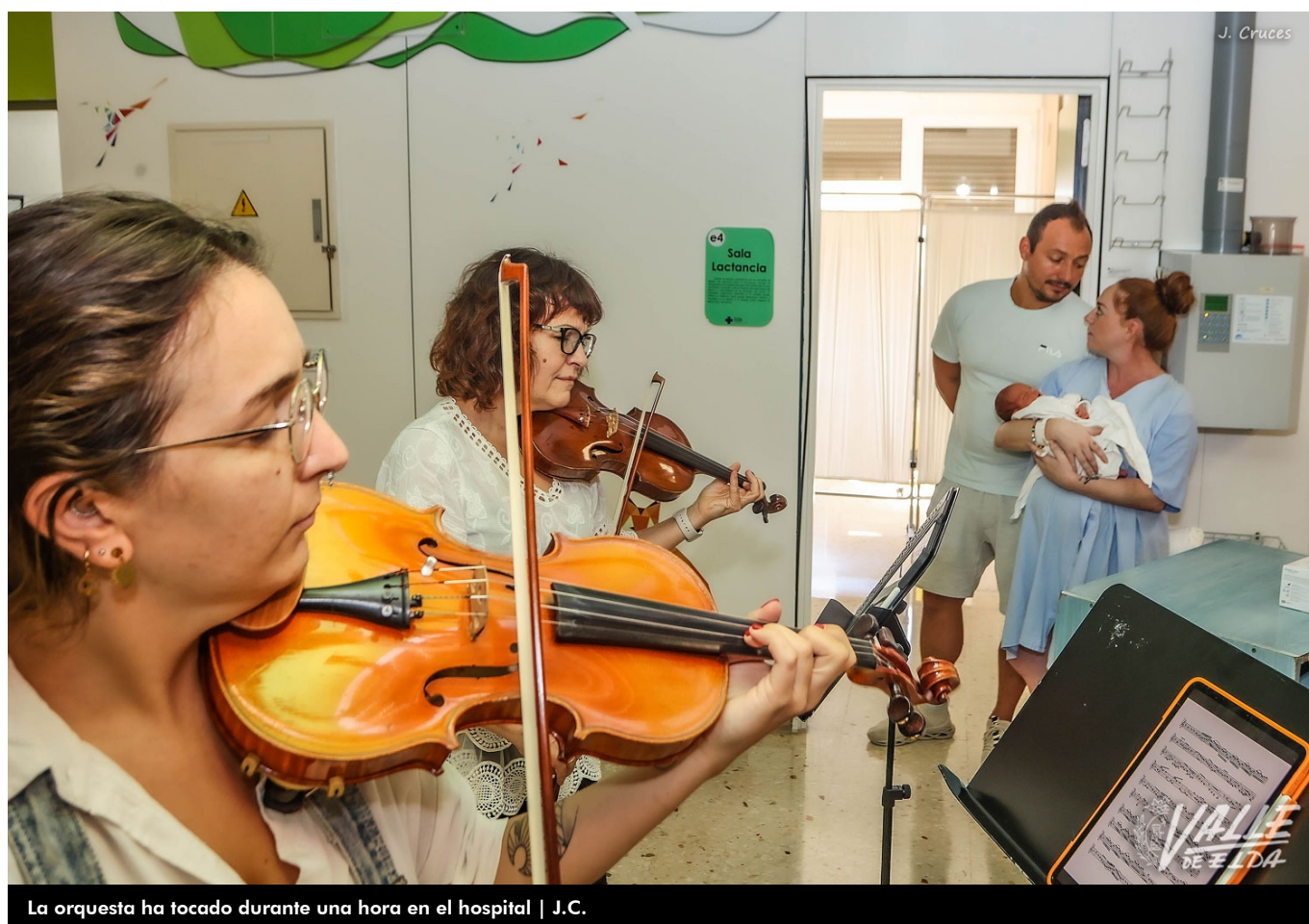
La orquesta ha tocado durante una hora en el hospital

La Orquesta ADDA Sinfónica ha actuado en el Hospital General Universitario de Elda durante una hora, de 11 a 12 horas, rompiendo así la rutina y llevando la alegría tanto a pacientes como a profesionales. El evento ha contado con más de 50 músicos que han tocado todo tipo de piezas con obras desde Beethoven hasta Queen o incluso Luis Fonsi con su "Despacito".