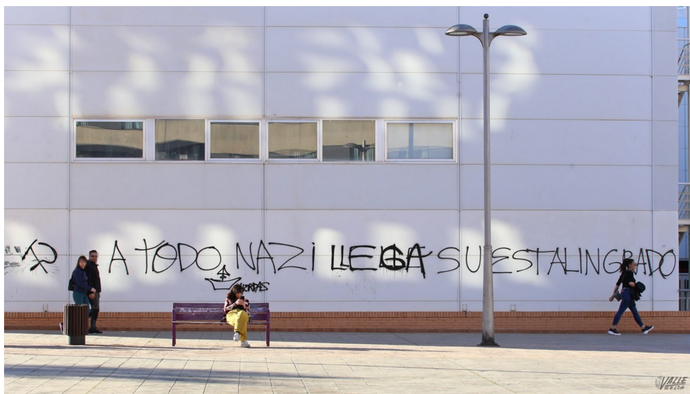
Imagen de la pintada realizada en la plaza de la Ficia.

“Fuera nazis de nuestro barrio”, “El enemigo viaja en yate, no en patera”, “Refugiados, no bienvenidos”, “No a los inmigrantes”, “Fuera símbolos fascistas de Elda-Petrer” o “A todo nazi llega su Stalingrado” son algunos de los mensajes que se pueden leer a lo largo y ancho de la ciudad desde hace algunos meses. Mensajes de signo radical, tanto de derecha como de izquierda, que proliferan cada vez más, a modo de batalla verbal, algunos con dobles mensajes.