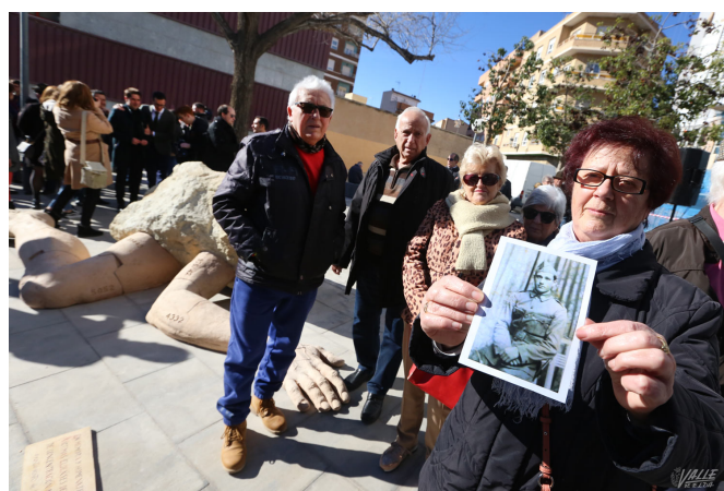
Los familiares de tres víctimas han agradecido el detalle del Ayuntamiento