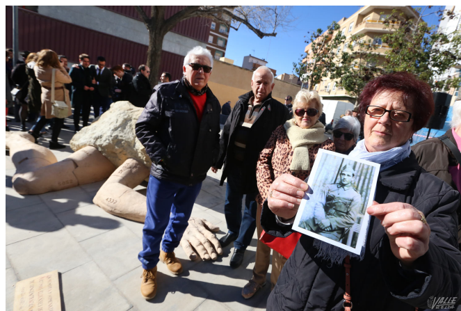
Los familiares de tres víctimas han agradecido el detalle del Ayuntamiento