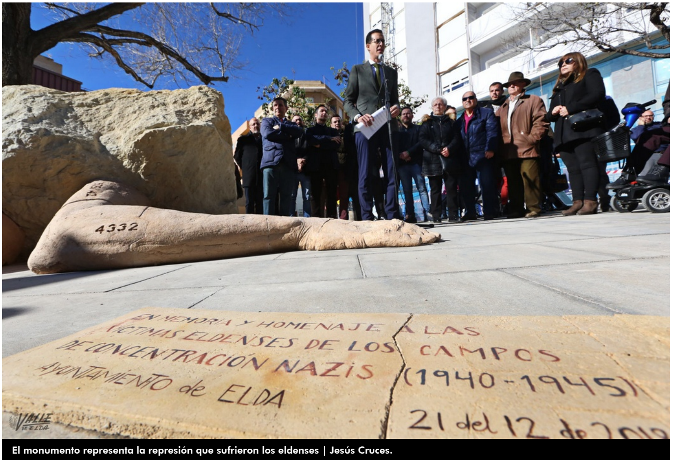
El monumento representa la represión que sufrieron los eldenses