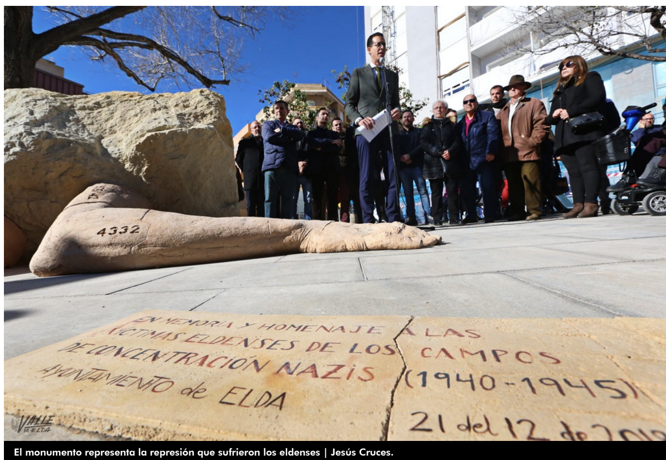
El monumento representa la represión que sufrieron los eldenses