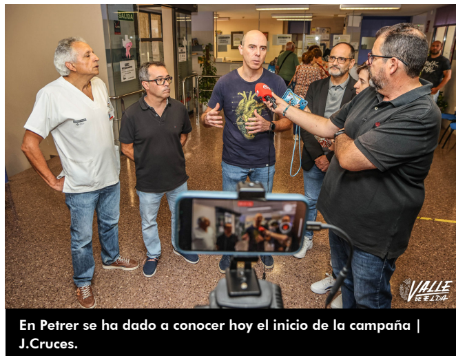
En Petrer se ha dado a conocer hoy el inicio de la campaña

Los usuarios tendrán que pedir cita previa en su centro de salud y a los mayores les llegará un mensaje de teléfono para recordarles que han de pedir cita en su centro de salud. Además, desde los centros de salud recuerdan que a las personas con movilidad reducida que no puedan acudir a los centros de salud se las vacunará en su propia casa.