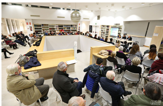
Momento de la presentación de la revista en la 2ª planta de la Biblioteca