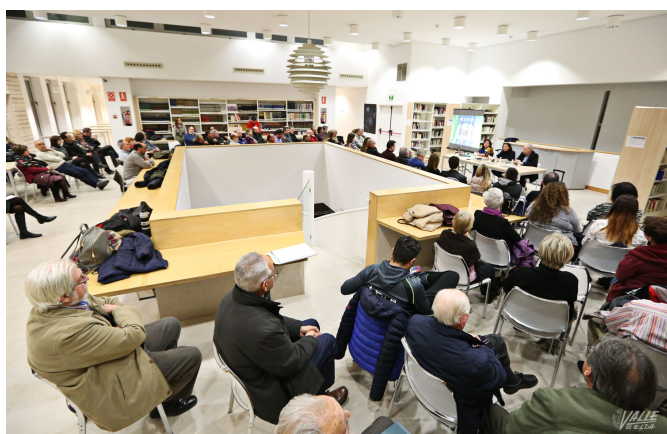
Momento de la presentación de la revista en la 2ª planta de la Biblioteca