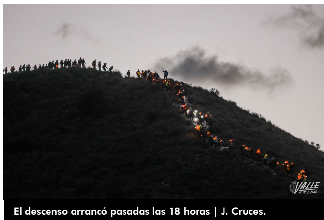
El descenso arrancó pasadas las 18 horas

A lo largo de todo el día cientos de personas, la mayoría familias, subieron a Bolón para cumplir con la tradición de tocar la cruz o participar en la bajada de antorchas. Sin embargo, debido a las fuertes rachas de viento a primera hora de la mañana se conoció que las antorchas de fuego no se podrían utilizar, sino solo las de led.