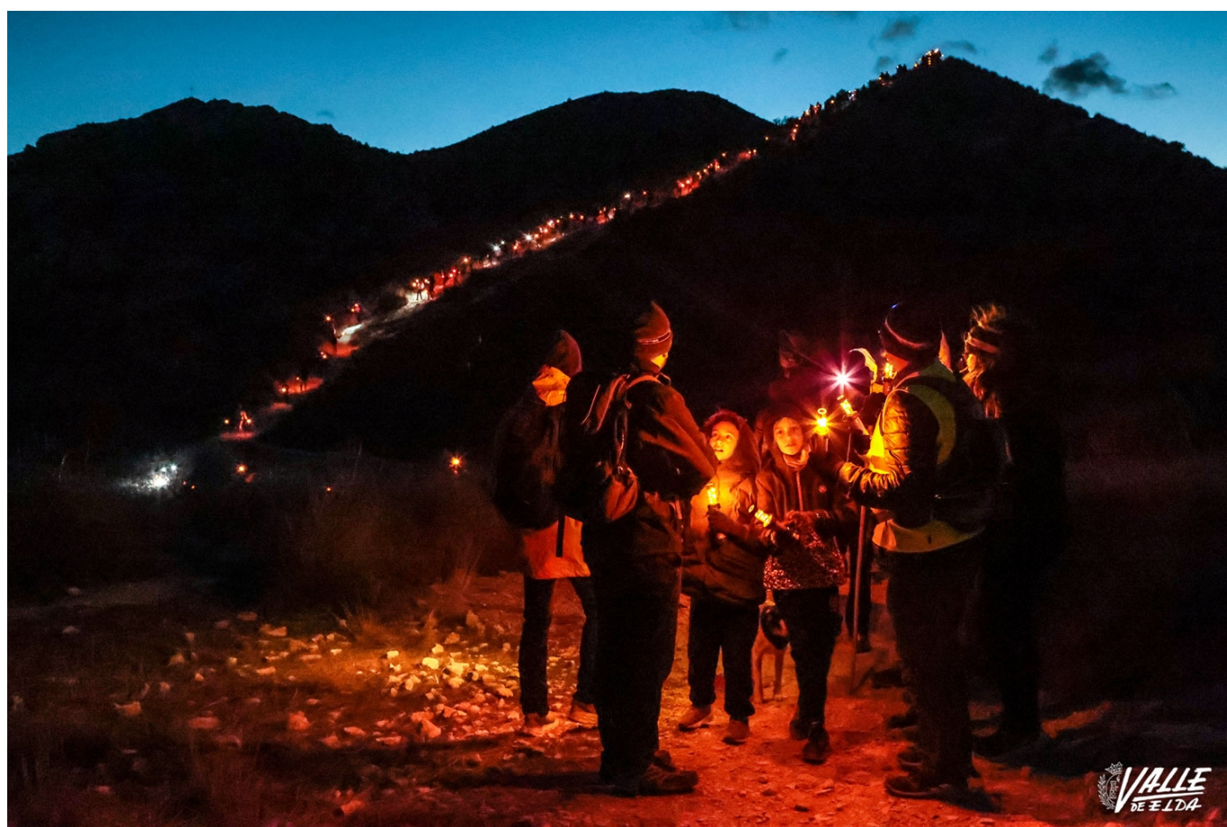
Más de cien personas participaron en esta tradición | J. Cruces.

Bolón volvió a iluminarse un año más para guiar a los Reyes Magos. A pesar de la breve lluvia y el fuerte viento que hizo durante todo el día, más de cien personas portaron antorchas de led para iluminar este monte en la noche más mágica del año.