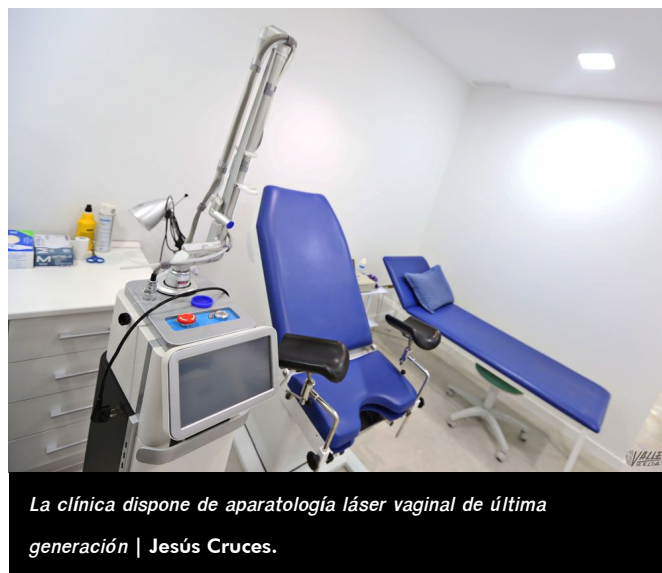
La clínica dispone de aparatología láser vaginal de última generación | Jesús Cruces.

Lo que para otras generaciones era normal, ahora las mujeres son más conscientes que todos estos problemas, que no tienen por qué repercutir en su calidad de vida, ni limitar su vida social, familiar o laboral.