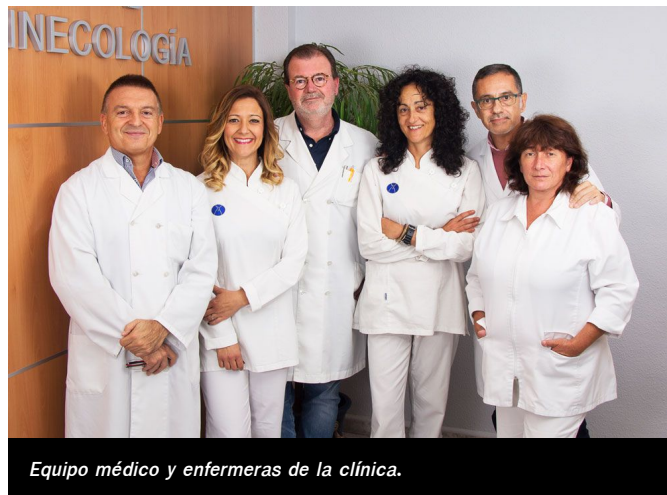
Equipo médico y enfermeras de la clínica.

Los más de 25 años de experiencia que avalan al equipo de especialistas de médicos ginecólogos y dermatólogo de la Clínica de Fertilidad y Ginecología Manjón, han servido para conocer y aplicar las novedosas tecnologías en materia de salud íntima de las mujeres, para ello ponen a disposición de sus pacientes sus amplias y nuevas instalaciones en la misma calle que les da su nombre, Padre Manjón 28, bajo.