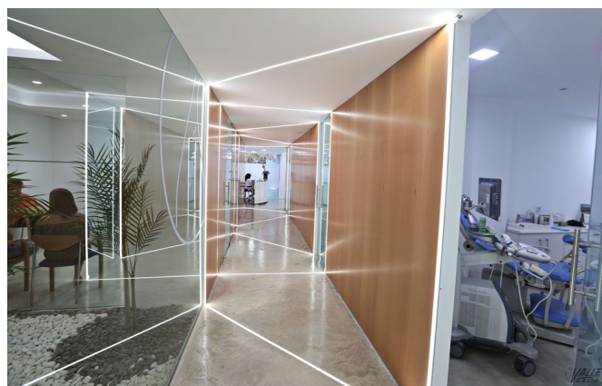
La empresa, con más de diez años de experiencia en el sector, ha acometido la reforma integral de la clínica | Jesús Cruces.

Araque Maqueda Construcciones y Rehabilitaciones es la empresa que ha realizado la reforma del nuevo y espectacular edificio de la Clínica de Fertilidad y Ginecología Manjón . Se trata de una empresa constructora especializada en reformas y obra nueva con