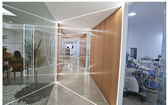
La empresa, con más de diez años de experiencia en el sector, ha acometido la reforma integral de la clínica | Jesús Cruces.

Araque Maqueda Construcciones y Rehabilitaciones es la empresa que ha realizado la reforma del nuevo y espectacular edificio de la Clínica de Fertilidad y Ginecología Manjón . Se trata de una empresa constructora especializada en reformas y obra nueva con