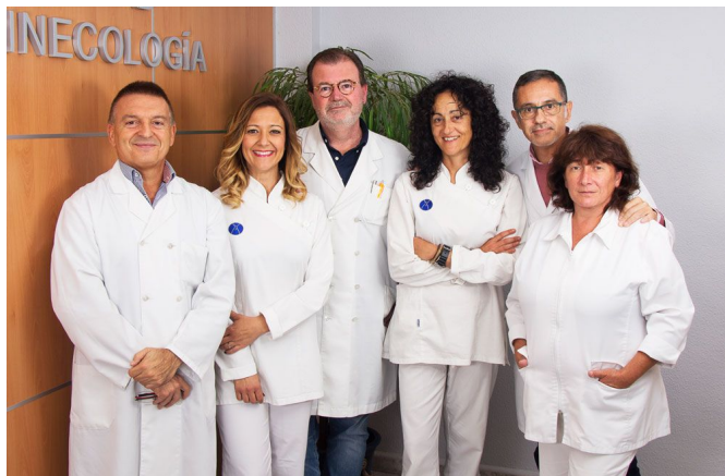
Equipo médico y enfermeras de la clínica.

Los más de 25 años de experiencia que avalan al equipo de especialistas de médicos ginecólogos y dermatólogo de la Clínica de Fertilidad y Ginecología Manjón, han servido para conocer y aplicar las novedosas tecnologías en materia de salud íntima de las mujeres, para ello ponen a disposición de sus pacientes sus amplias y nuevas instalaciones en la misma calle que les da su nombre, Padre Manjón 28, bajo.