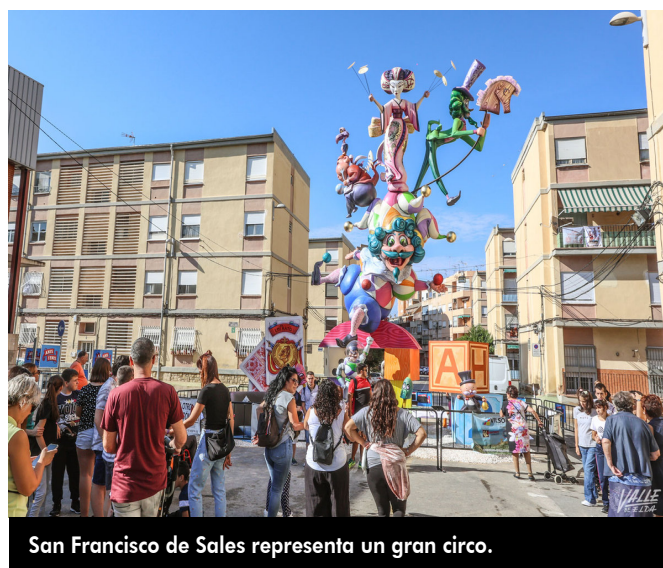
San Francisco de Sales representa un gran circo.

La mayor "Y tú a qué juegas?" representa la marcha del rey Juan Carlos I a los Emiratos en una gran baraja en la que también están presentes los actuales reyes y, a través de los juegos como la pilota, piden que no se olviden las tradiciones y olviden las "Fiestologías". Recoge a Pedro Sánchez como Buzz Lightyear para criticar que los precios subirán "hasta el infinito y más allá", y a través del juego de Hundir la flota, aluden a la sanción a Huerta Nueva, representada como un gran navío que derrota al resto de comisiones al pedir perdón.