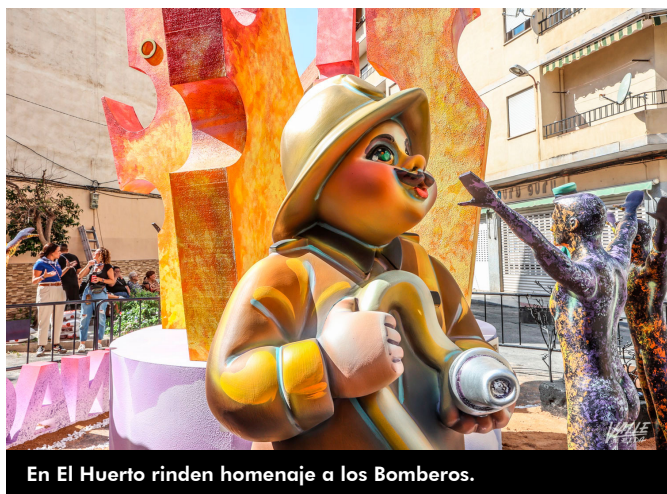
En El Huerto rinden homenaje a los Bomberos.