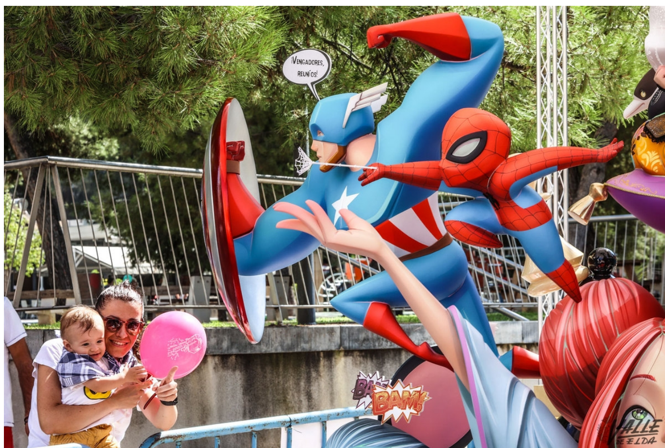
Las fallas devuelven la vida y el color a las calles de Elda.

Los eldenses ya están visitando los imponentes monumentos que han vuelto a llenar de color y alegría los nueve distritos falleros. Con agudas críticas así como con trabajados e imaginativos ninots, las fallas vuelven a recoger la actualidad social con su tradicional dosis de humor. Un año más, destacan los comentarios sobre noticias locales, pero también en torno a la pandemia y la invasión a Ucrania. Lo cierto es que cada comisión ha tocado un gran abanico de temas. Como es costumbre, resalta el ingenio entre las críticas, cargadas de ironía y humor, pues si algo recalcan los falleros es que no buscan molestar. Abundan los textos en valenciano junto