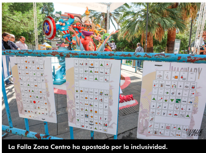
La Falla Zona Centro ha apostado por la inclusividad.