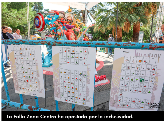
La Falla Zona Centro ha apostado por la inclusividad.