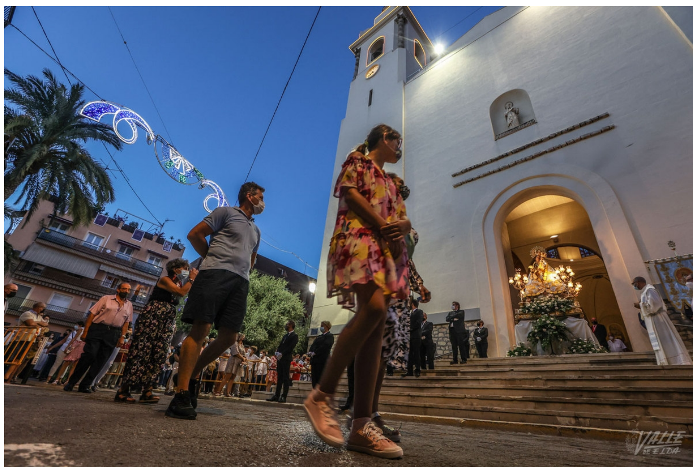
La población pasó en fila para saludar a la Virgen | J.C.

La devoción de Elda por la Virgen de la Salud volvió a ser palpable anoche en su día grande. La procesión se cambió por un saludo desde la puerta de la iglesia de Santa Ana , las velas por las mascarillas y la cercanía por la distancia física. Pero pese a ello, la ciudad volvió a encontrarse con su patrona en la calle dos años después.