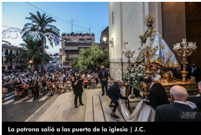
La patrona salió a las puerta de la iglesia | J.C.

situación pase pronto y que no se lleve a nadie más.