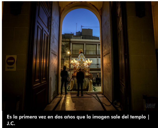
Es la primera vez en dos años que la imagen sale del templo

La ciudad celebra hoy el día de su patrón, el Cristo de Buen Suceso, a las 11 horas será la Misa mayor a cargo del joven sacerdote eldense Bernabé Rico. A las 18:30 será la Santa Misa seguida de la Salve Grande y el saludo al Cristo del Buen Suceso.