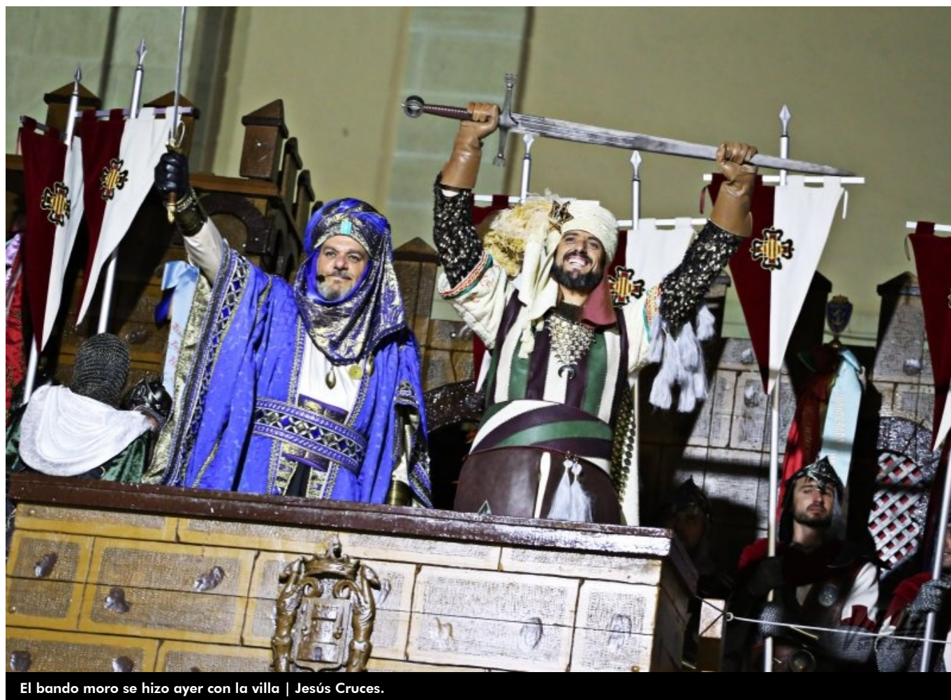
El bando moro se hizo ayer con la villa | Jesús Cruces.

Petrer viajó ayer en el tiempo para rememorar su historia . La Plaza de Baix se convirtió en el terreno de batalla entre Moros y Cristianos en el que ganan los primeros durante la Embajada Mora . La pólvora hizo su aparición con las 18:30 horas con la Guerrilla, donde cientos de arcabuceros recorrieron la calle Constitución dando vía libre a los fognazos y estallidos de sus armas.