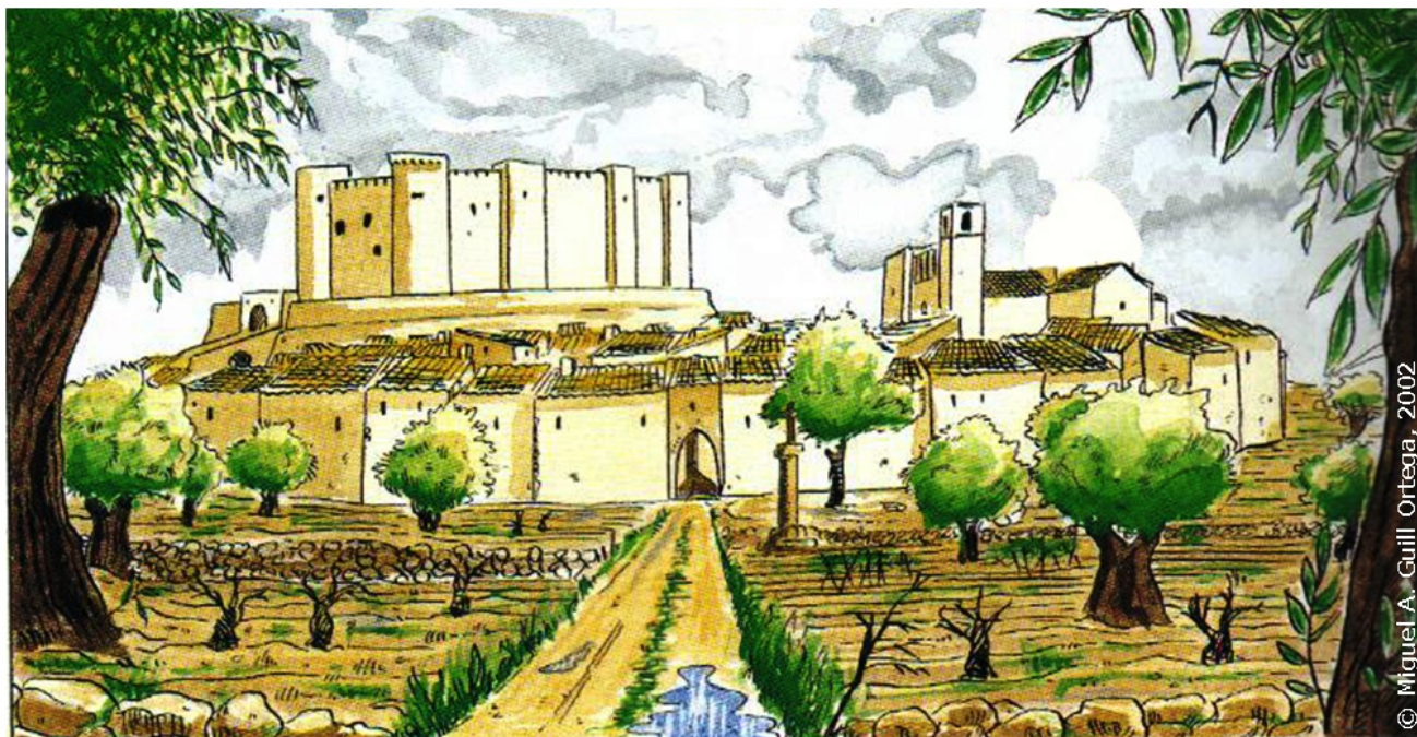
Vista panorámica de la villa de Elda a principios del siglo XVIII