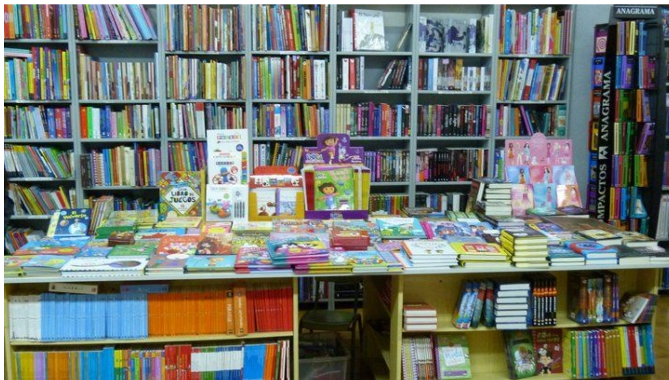
Librerías como Martín Fierro te ofrecen libros de todo tipo.

Decía Marcel Proust que “el encuentro afortunado de un buen libro puede cambiar el destino de nuestras almas” . Y qué lugar más propicio en el que hallar un buen libro que en las bibliotecas o en las librerías. De las primeras, hablaré en una próxima entrada. En cuanto a las librerías, y según se desprende del reciente informe Observatorio de la librería publicado el pasado 23 de noviembre por el Ministerio de Educación, su número aumentó casi un 4% en 2016 aunque por el contrario se estancaron sus ventas, frente a los amplios beneficios obtenidos en las grandes cadenas.