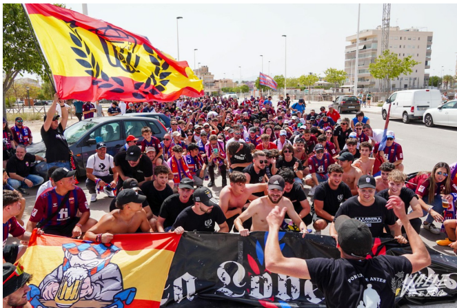
La afición se ha volcado en este partido | Nando Verdú.

quien se ha caído de la convocatoria, así como la vuelta de Álex Martínez, que no jugaba desde la jornada 27 ante el Tenerife .