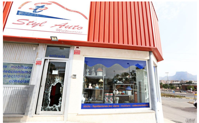
A través de esta abertura accedieron al interior del negocio | Jesús Cruces.

Además en en el centro de Elda se han producido varios intentos de robo por dos toxicómanos conocidos por la policía , que entran a las casas por las terrazas o patios a través de obras próximas con el propósito de llevarse dinero en metálico u oro.