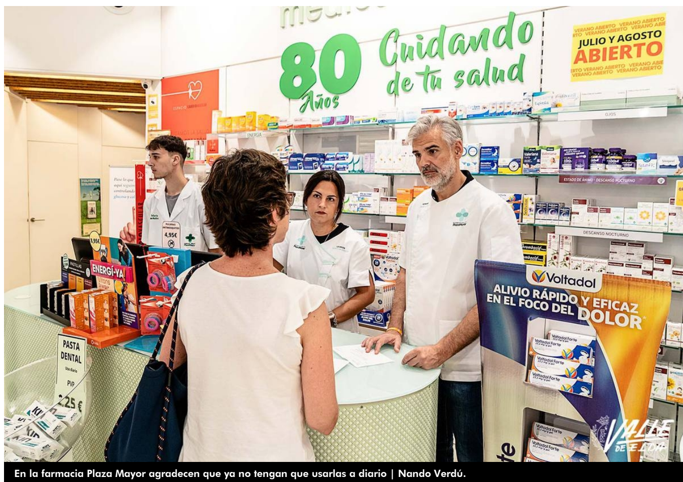
En la farmacia Plaza Mayor agradecen que ya no tengan que usarlas a diario | Nando Verdú.

Se acabó el volver a casa a por una mascarilla o comprar una de urgencia para entrar en los centros sanitarios, farmacias o residencias. Desde hoy ya no es obligatorio su uso, aunque sí recomendable. Así se deja definitivamente atrás la pandemia del coronavirus, que empezó en marzo de 2020. El Consejo de ministros aprobó ayer el real decreto que ha entrado hoy en vigor.