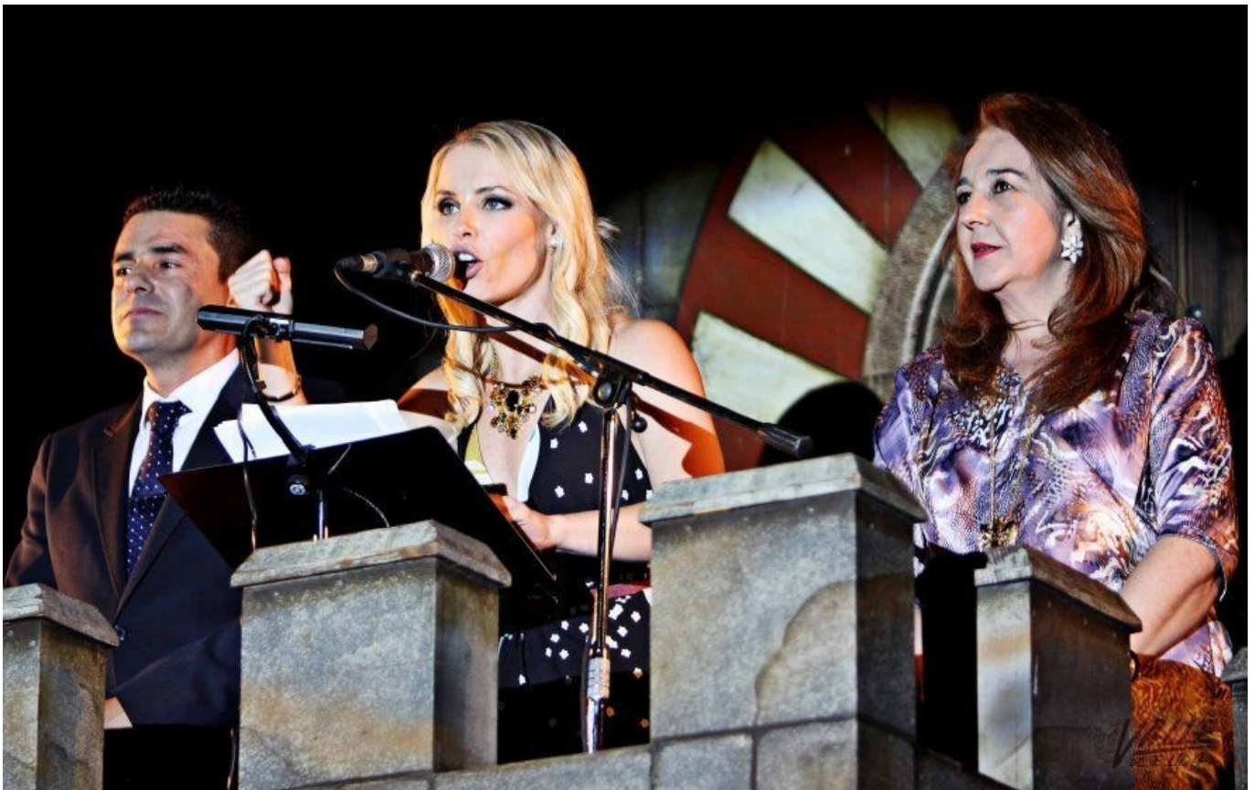
Soraya Arnelas anuncia la llegada de los Moros y Cristianos | Jesús Cruces

La cantante Soraya Arnelas fue la encargada de anunciar anoche la llegada de las fiestas de Moros y Cristianos de Elda desde lo alto del Castillo de Embajadas. La pregonera fue recibida entre aplausos e hizo aflorar los sentimientos festeros del público que se acercó a la calle Colón para celebrar el comienzo de las fiestas. Arnelas destacó los nervios previos que estaban sintiendo los eldenses en ese momento "porque comienza algo grande: sus Moros y Cristianos". Asimismo realizó un llamamiento al "mundo entero" para que acudan a Elda a disfrutar de sus cinco días festivos.