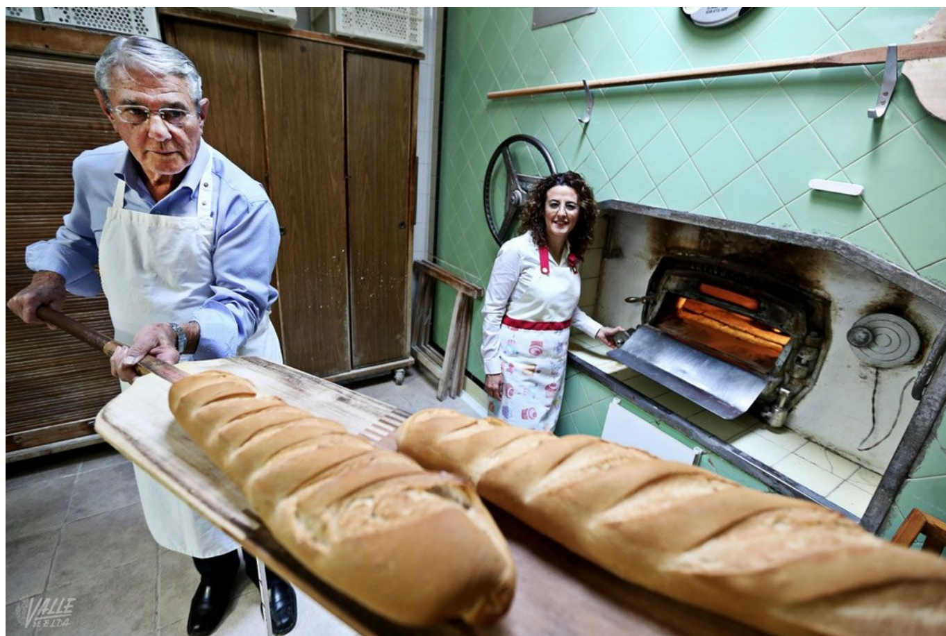
Empresas de Elda y Petrer que han pasado de padres a hijos, o incluso vienen de sus abuelos.

El relevo generacional en empresas de distintos sectores de Elda y Petrer está garantizado, como se puede observar en este especial que el periódico Valle de Elda ofrece esta semana a sus lectores.