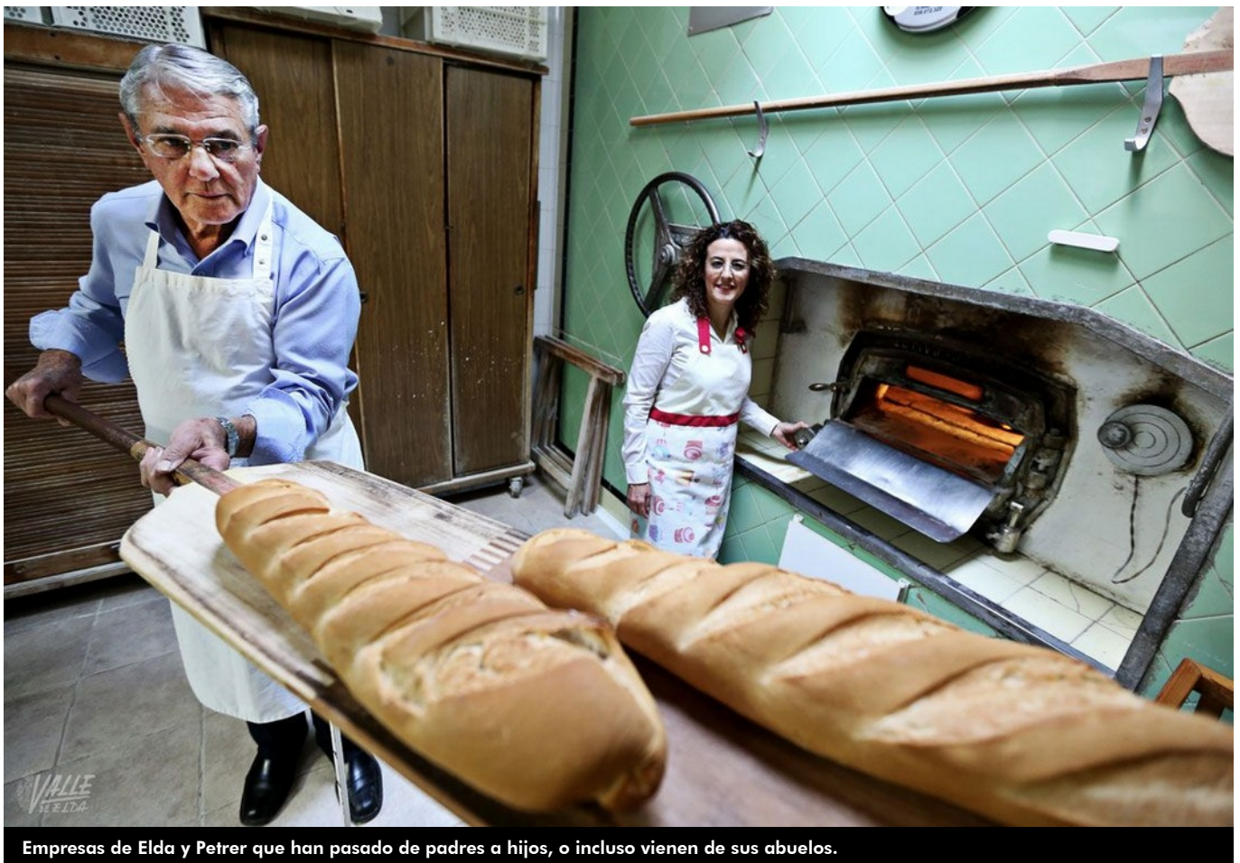
Empresas de Elda y Petrer que han pasado de padres a hijos, o incluso vienen de sus abuelos.

El relevo generacional en empresas de distintos sectores de Elda y Petrer está garantizado, como se puede observar en este especial que el periódico Valle de Elda ofrece esta semana a sus lectores.