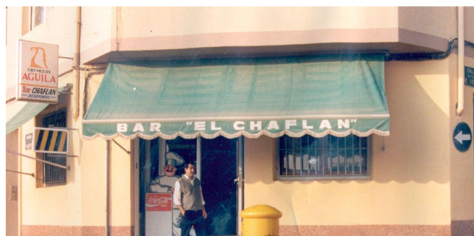
Sus inicios fueron en el bar El Chaflán ofreciendo comida tradicional.

Actualmente disponen de un local cerca del antiguo Chaflán, pero en unas instalaciones totalmente reformadas, amplias y luminosas, con tres cocinas, cuatro salas independientes y zona infantil. Su nueva decoración es moderna, acogedora y dispone de un aforo para mil personas.