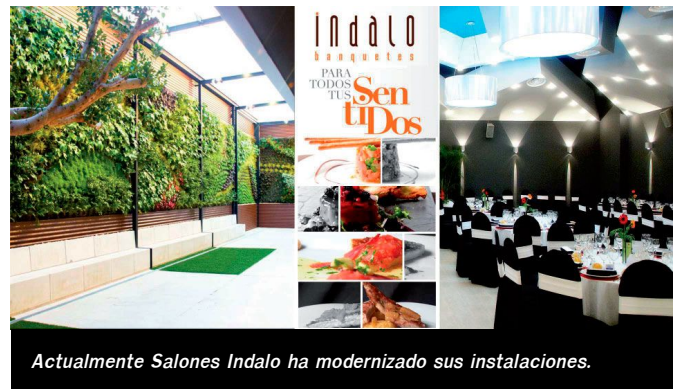
Actualmente Salones Indalo ha modernizado sus instalaciones.

Salones Indalo tiene su origen en 1983 cuando era un bar de un barrio modesto en la localidad de Petrer. Entonces disponía solo de diez mesas y una pequeña cocina tradicional. Con el paso del tiempo, la familia vio la posibilidad de gestionar un salón de banquetes, conocido como El Chaflán, donde comenzaron a servir banquetes, era un local ubicado en la zona de la Foia, que dirigieron durante diez años.