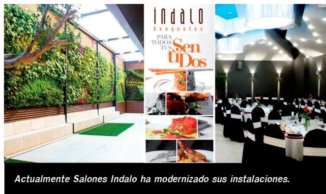
Actualmente Salones Indalo ha modernizado sus instalaciones.

Salones Indalo tiene su origen en 1983 cuando era un bar de un barrio modesto en la localidad de Petrer. Entonces disponía solo de diez mesas y una pequeña cocina tradicional. Con el paso del tiempo, la familia vio la posibilidad de gestionar un salón de banquetes, conocido como El Chaflán, donde comenzaron a servir banquetes, era un local ubicado en la zona de la Foia, que dirigieron durante diez años.