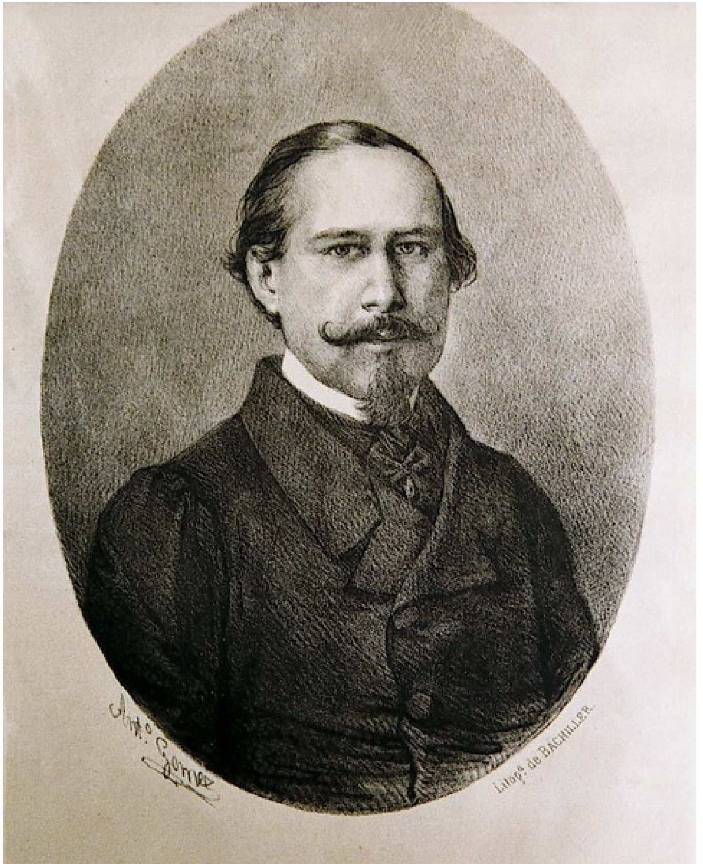
Juan Rico y Amat (Elda, 1821-Madrid, 1870).