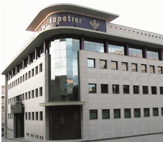
La sede central de Caixapetrer fue inaugurada el 5 de octubre de 2001.

Para saber más sobre esta caja del pueblo podéis descargar gratuitamente en la plataforma digital bibliopetrer.petrer el trabajo sobre esta entidad publicado en la revista Festa 2020 .