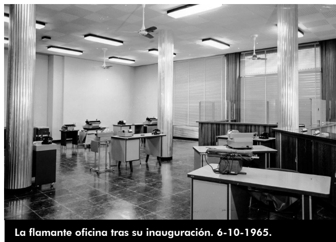
La flamante oficina tras su inauguración. 6-10-1965.