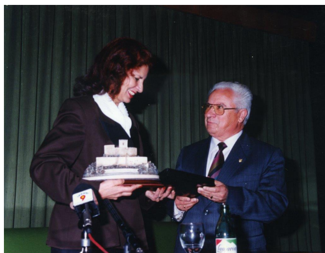
La Caja de Crédito siempre apoyó la cultura y desde su inicio fue un pilar fundamental del ciclo de conferencias Otoño Cultural. Carmen Alborch, ministra de Cultura y Vicente Rico, presidente de Caixapetrer. Año 1995.

En la actualidad apenas quedan oficinas bancarias en nuestras poblaciones y nuestra caja sigue estando ahí manteniendo un buen número de ellas con el fin de prestar los servicios financieros que necesitan sus socios y clientes y, una vez más, sigue adaptándose a los cambios sociales y culturales trabajando por la pervivencia de este maravilloso legado que es Caixapetrer.