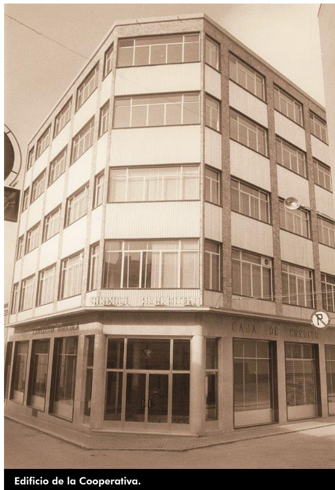
Edificio de la Cooperativa.

pertenecer todos los socios de la Cooperativa. En las plantas superiores destacaba un salón de actos que se cedía para actividades culturales, una biblioteca y un salón que se utilizaba para las reuniones de trabajo de la caja. A principios de los años 80 se realizó una reforma importante y se hizo un moderno y equipado salón de actos y una sala de exposiciones en la tercera planta. Sobre 1969 la cuarta planta se destinó a aulas escolares para alumnos del colegio Primo de Rivera.