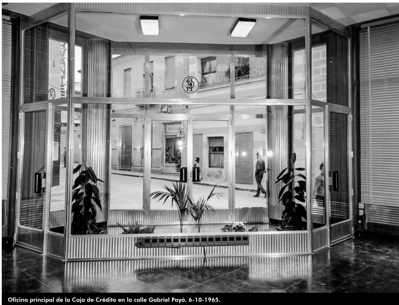
Oficina principal de la Caja de Crédito en la calle Gabriel Payá. 6-10-1965.

El cambio económico y social que vivió Petrer, que dejó de ser un pueblo agrícola para transformarse en industrial y empezó a nutrirse y crecer con la intensa llegada de inmigrantes dejó obsoleta la Caja Rural de Ahorros y Préstamos fundada a principios de siglo y que sólo daba un servicio completo a los agricultores y sus familias. Los empresarios y trabajadores del calzado y su industria auxiliar, los comerciantes y el embrionario sector de servicios sólo podían tener a su recaudo sus ahorros, pero no podían obtener otros servicios bancarios. Así que para acomodarse a los nuevos tiempos la Caja Rural se