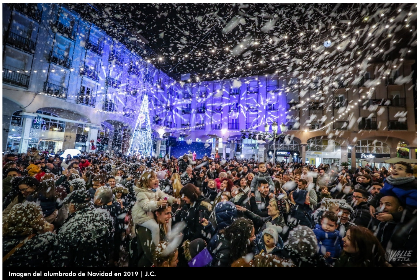
Imagen del alumbrado de Navidad en 2019