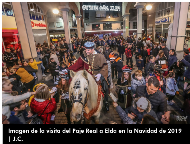
Imagen de la visita del Paje Real a Elda en la Navidad de 2019