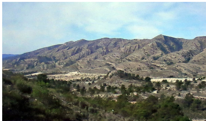
La Sierra de la Umbría, también conocida como Las Barrancadas.

En el caso de Elda, fueron subastadas las sierras de Camara , de las Barrancadas y la Torreta-Lobera . Por su parte, los montes de Bolón y Bateig , dado su escaso interés agrícola y forestal, fueron reservados para el abastecimiento de leña y atocha por la población mas desfavorecida.