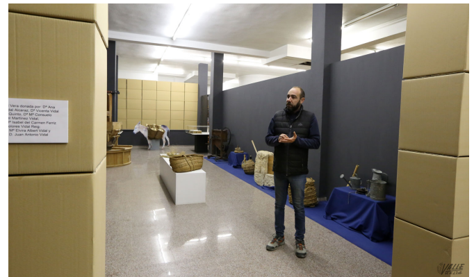
El Museo Etnológico ha sido decorado con cajas de cartón debido a la falta total de presupuesto del mismo | Jesús Cruces.

Mientras esperan ayudas públicas, los museos del Calzado, Etnológico y Arqueológico permanecen en la UCI , aunque estables dentro de la gravedad.