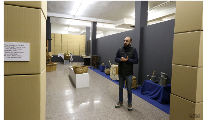
El Museo Etnológico ha sido decorado con cajas de cartón debido a la falta total de presupuesto del mismo | Jesús Cruces.

Mientras esperan ayudas públicas, los museos del Calzado, Etnológico y Arqueológico permanecen en la UCI , aunque estables dentro de la gravedad.