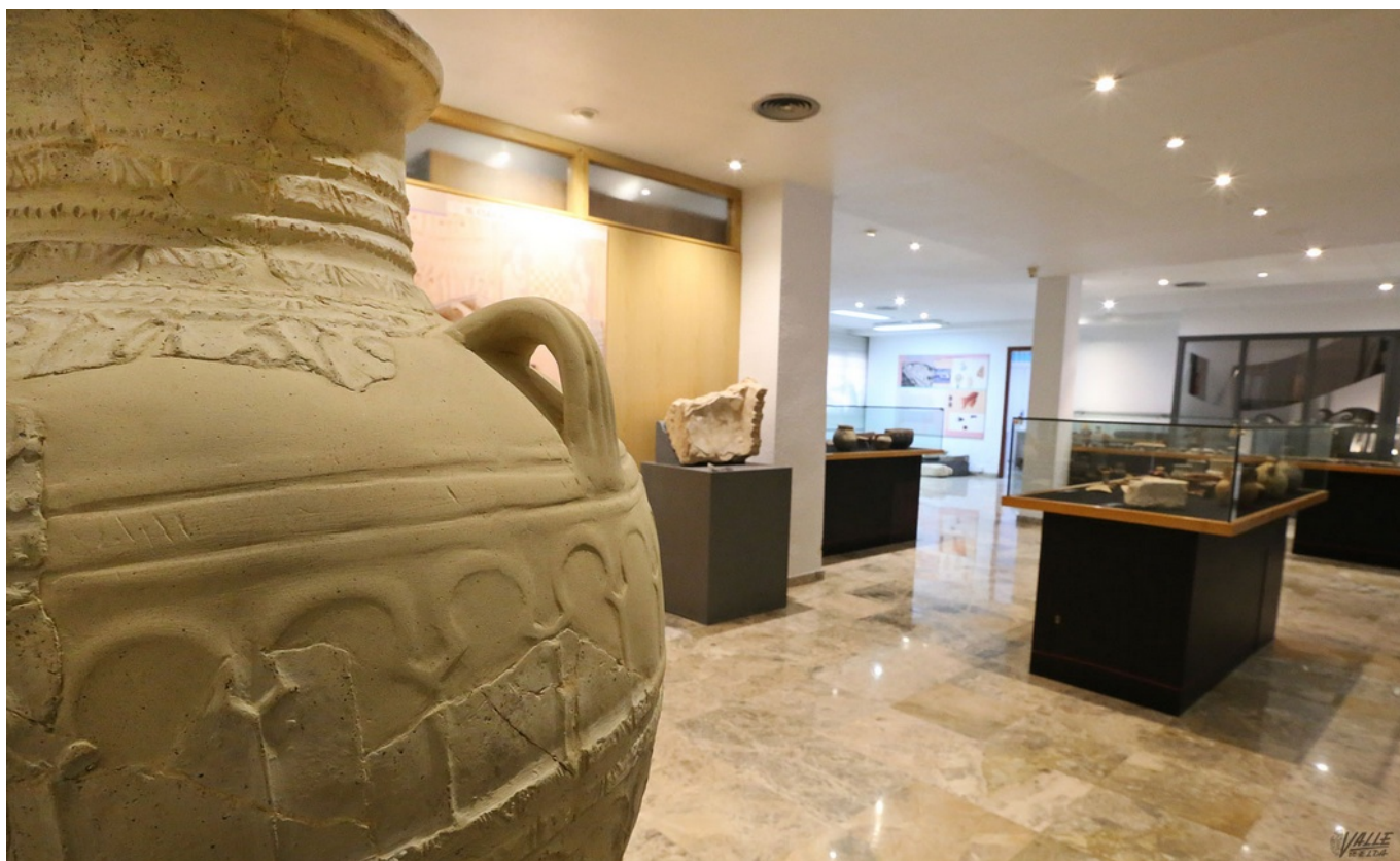
Las instalaciones de los tres museos son antiguas | Jesús Cruces.

Elda cuenta con tres museos, el del Calzado, el Etnológico y el Arqueológico , y los tres se encuentran en estado crítico . No solo carecen de presupuesto suficiente , sino que los dos primeros les ahogan las deudas . Esto impide que puedan realizar actividades o se renueven para ser atractivos para el público. Sus tres directores tienen claro que el problema es la falta de apoyo institucional, de hecho admiten que "abandonados" .