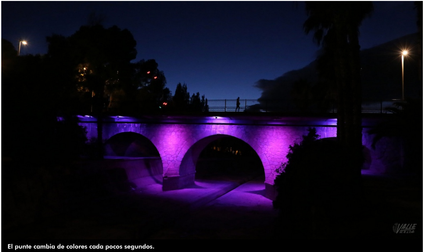
El puente cambia de colores cada pocos segundos.

Los vecinos que hayan pasado de noche por la avenida Novo Hamburgo se habrán sorprendido al encontrar el puente de la Estación, a los pies del castillo, iluminado con luces de múltiples colores . Al acercarse hasta los Jardines del Vinalopó se puede apreciar lo que en este periodo es una bonita estampa navideña , que disfrutarán deportistas y quienes pasen por este punto.