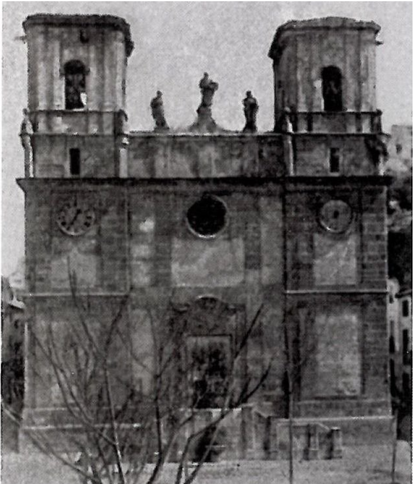
Iglesia de San Bartolomé Apóstol, principios del siglo XX.

En Petrer por lo que se refiere a los patronazgos se conoce desde antiguo el de San Bartolomé Apóstol , abogado contra los malos espíritus, titular de la iglesia parroquial desde el siglo XV , mucho antes de la expulsión de los moriscos.