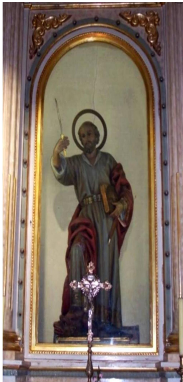
Imagen actual de San Bartolomé apóstol, bendecida tras la Guerra Civil.

se disparaba una mascletà que revestía gran espectacularidad.