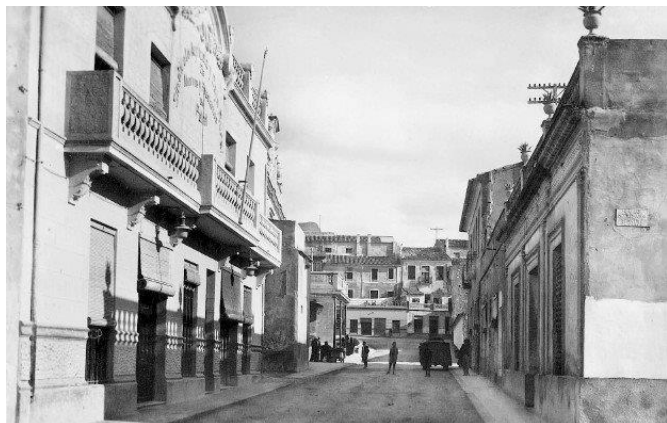
La calle Gabriel Payá, en primer término, el emblemático edificio del Sindicato Agrícola y Caja Rural de Ahorros y Préstamos de Petrel.

de esta agrupación política, en el domicilio del presidente D. Gabriel Payá Payá (1831-1905), con objeto de solemnizar la inauguración de la calle de este nombre, de su propiedad, con asistencia de nutridas comisiones de los demás partidos del municipio, con su presidente el popular alcalde D. Víctor Ponti Castillo , clero parroquial y señores jueces de instrucción y municipal, el Sr. Payá obsequió a los invitados con un espléndido lunch , en el que hubo verdadero derroche de pastas, dulces, licores y habanos.