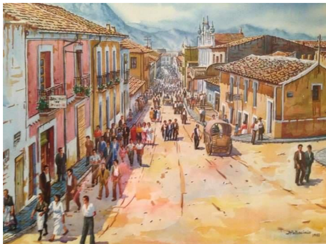
Acuarela del pintor Patrocino Navarro basándose en la fotografía de la calle de 1935.