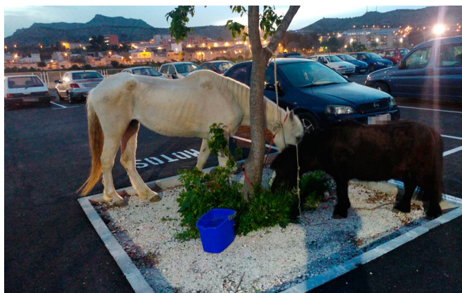
Los animales hambrientos se alimentaban de las plantas que encontraban en el camino.

numerosas heridas, totalmente a oscuras, entre heces, no tenían ni comida ni agua. Lo que más les chocó, asegura, fue que el poni había perdido un ojo , del que le salía una gran cantidad de pus.