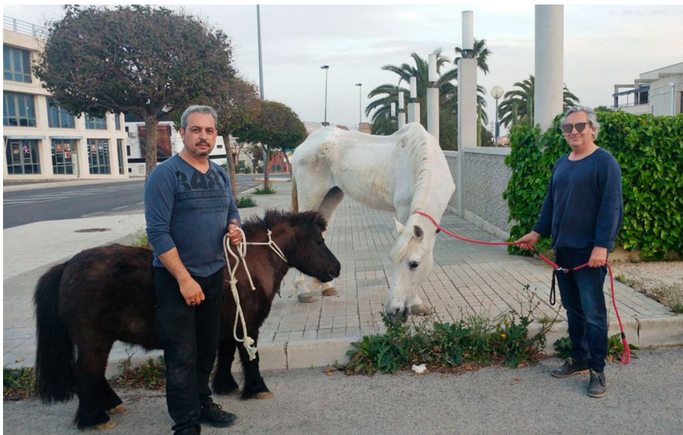
El poni y la yegua fueron trasladados a pie hasta la Policía Local de Elda.

Tras más de cuatro meses de investigaciones, la Agrupación Defensora de los Animales, ADA y la Policía Local de Elda salvaron ayer una yegua, un poni y tres galgos cuyo estado era lamentable, con heridas y esqueléticos , en una casa cueva situada en la rambla del Sapo, a espaldas del tanatorio. Aunque se tenía constancia de un solo caballo, lo que encontraron a su llegada fue "grotesco" .