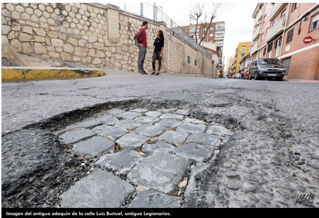
Imagen del antiguo adoquín de la calle Luis Buñuel, antigua Legionarios.

Un socavón ha permitido descubrir una parte de la historia ya desaparecida de la Elda de hace menos de un siglo. Se trata de una de las primeras calzadas de la ciudad, en concreto de la calle Luis Buñuel , anteriormente conocida como calle Legionarios. Una carretera de adoquín que se colocó entre 1955 y 1956 tanto en esta vía como en las calles Nueva (entonces Generalísimo) y Ortega y Gasset (antigua General Mola), que por entonces eran las más importantes de la localidad.