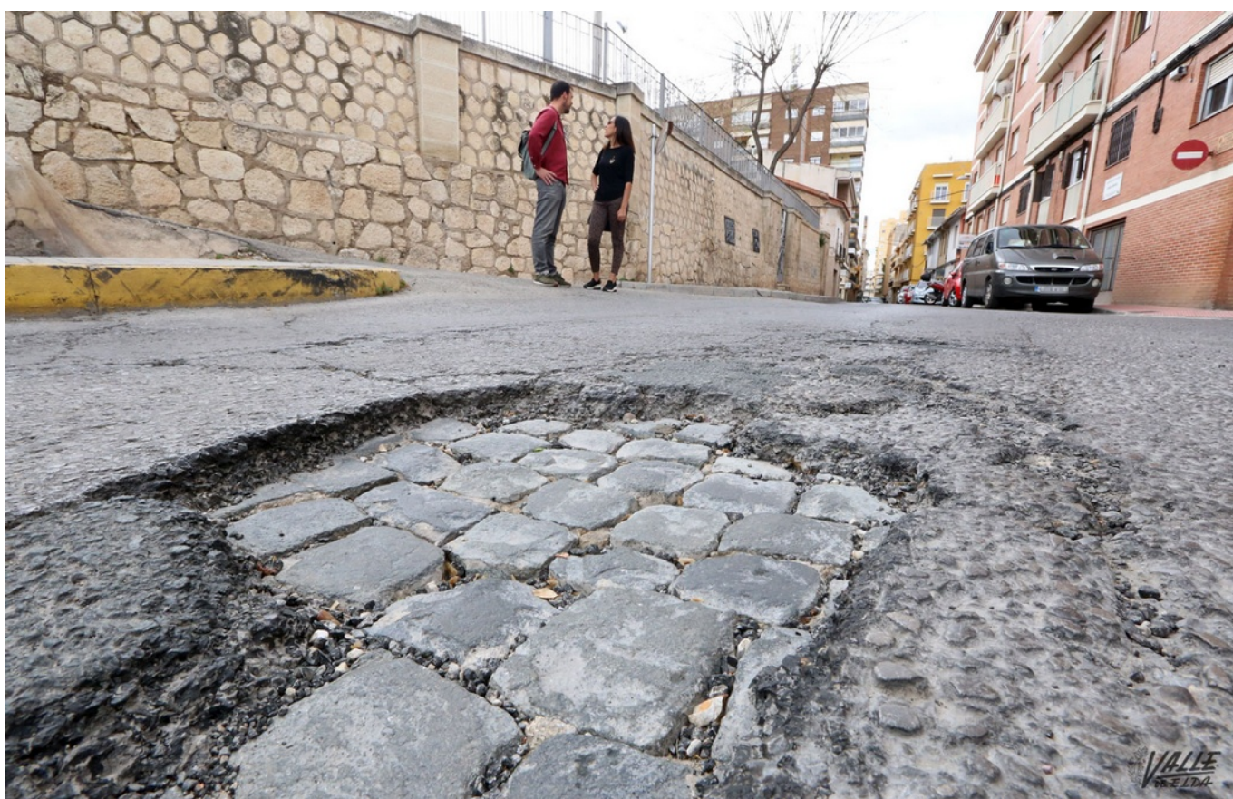
Imagen del antiguo adoquín de la calle Luis Buñuel, antigua Legionarios.

Un socavón ha permitido descubrir una parte de la historia ya desaparecida de la Elda de hace menos de un siglo. Se trata de una de las primeras calzadas de la ciudad, en concreto de la calle Luis Buñuel , anteriormente conocida como calle Legionarios. Una carretera de adoquín que se colocó entre 1955 y 1956 tanto en esta vía como en las calles Nueva (entonces Generalísimo) y Ortega y Gasset (antigua General Mola), que por entonces eran las más importantes de la localidad.