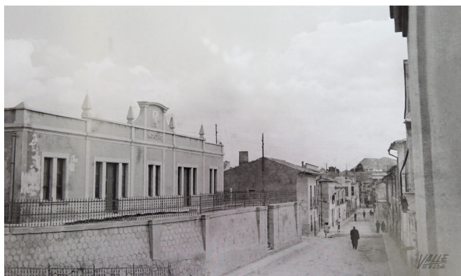
Imagen de la calle Legionarios, actual Luis Buñuel.