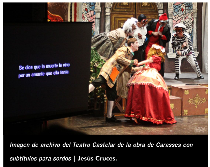
Imagen de archivo del Teatro Castelar de la obra de Carasses con subtítulos para sordos

Cabe destacar que en Elda se realizó una obra de teatro en 2011 adaptada a personas con deficiencia auditiva, ya que Apanah instaló un bucle portátil, por lo que podían escuchar con claridad las personas de las primeras filas; además el grupo Carasses habilitó una pantalla en la que se leía el texto que recitaban los actores.