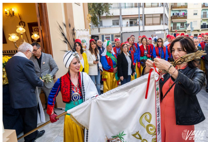
La presidenta prendió los corbatines en ambas banderas

La comparsa valiente volvió al Casino Eldense a ritmo de pasodoble, encabezados por el nuevo estandarte, los arcabuceros y las Capitanías 2024. Este pasacalle transcurrió por las calles Independencia, Magdalena Maestre, Espoz y Mina, Constitución, Colón y Nueva, hasta las puertas del Casino Eldense, donde los cargos 2024, junto a los arcabuceros, vieron desfilar al resto de comparsa, que acabó el recorrido en la confluencia de las calles Nueva con Ortega y Gasset.