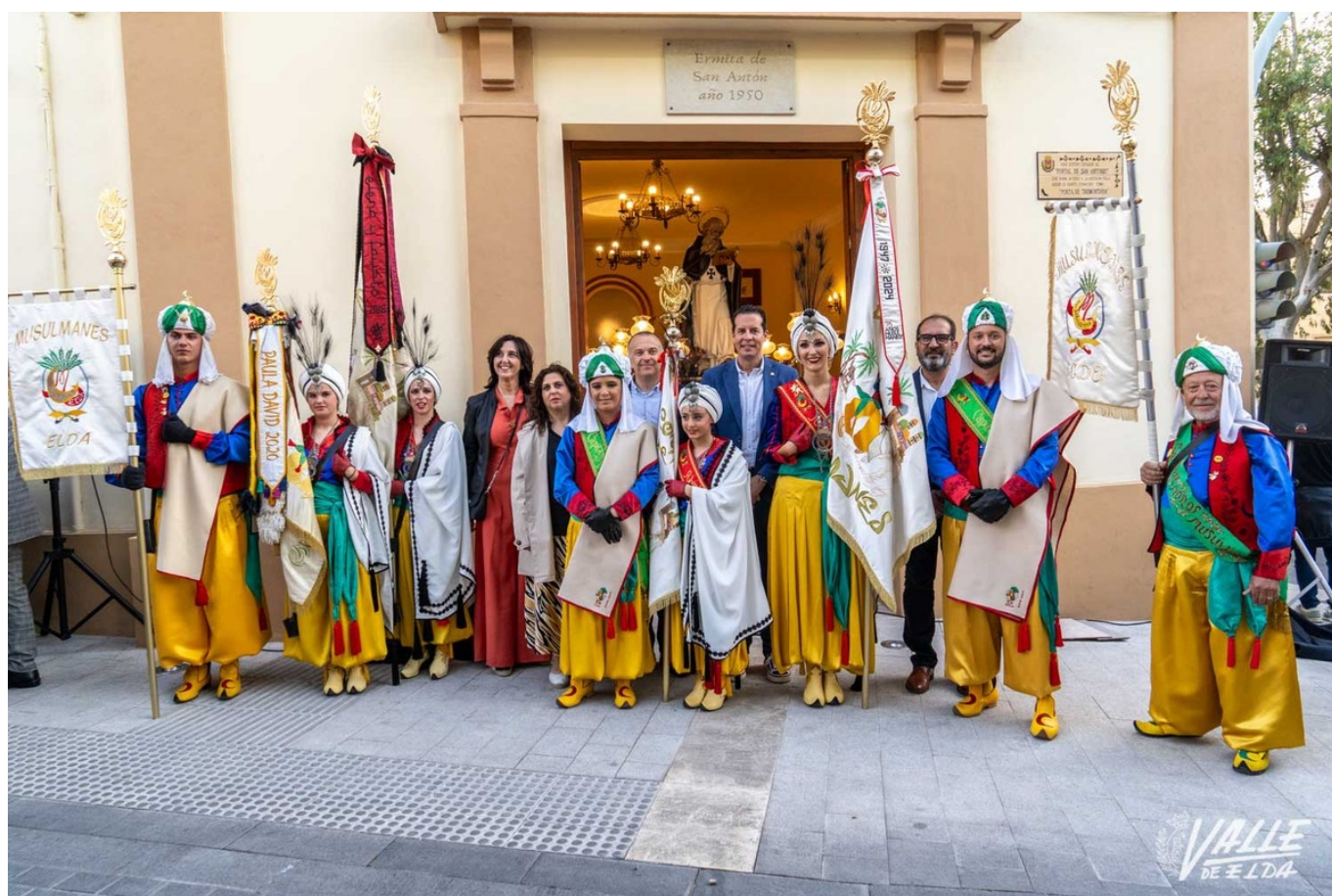
La bendición se ha realizado ante San Antón

Los Moros Musulmanes continúan con los actos correspondientes con la celebración de su 75 aniversario. El viernes se inició un intenso fin de semana con su gala y ayer la comparsa valiente bendijo las nuevas banderas y estandarte en la ermita de San Antón. El acto contó con la participación 600 miembros de la comparsa, todos ellos con sus feces, y se disparó una salva de arcabucería.