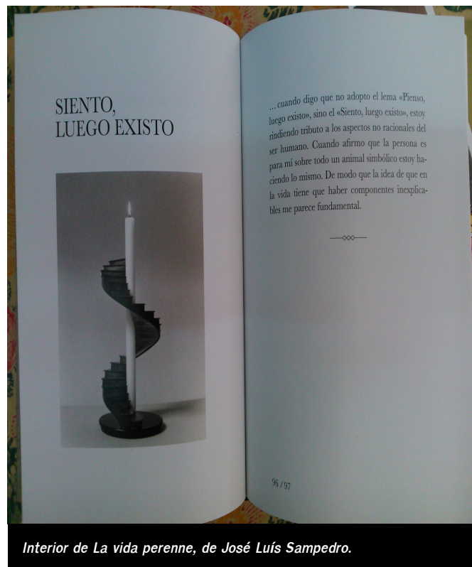
Interior de La vida perenne , de José Luís Sampedro.

"Para mí la tarea del hombre debe ser doble: por una parte, la persecución de una trayectoria consistente en hacerse lo que se es, y por otra, frente a lo imprevisible, adoptar una actividad digna de un ser humano. Pero no es que sean dos objetivos diferentes, pues sólo haciéndose se gana dignidad, y sólo dignamente tiene sentido hacerse".