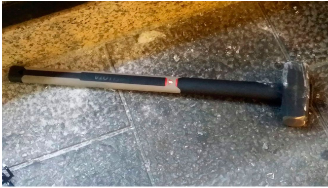
Imagen del mazo que se utilizó el pasado sábado en el robo, similar al usado en este hurto.

un vehículo para huir rápidamente del lugar.