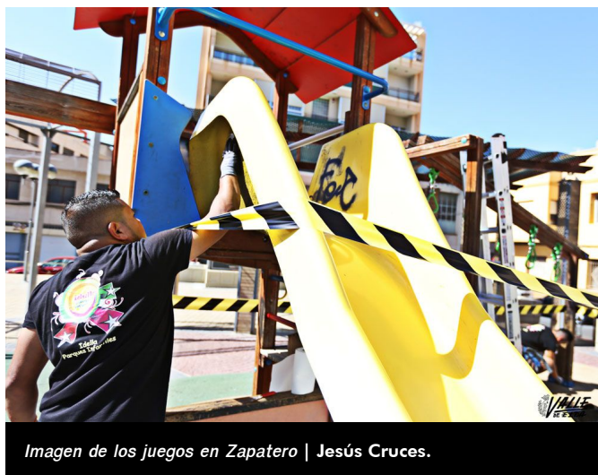
Imagen de los juegos en Zapatero | Jesús Cruces.

La nueva contrata tiene un presupuesto de 18.000