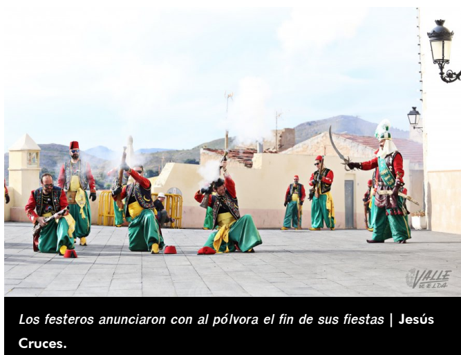
Los festeros anunciaron con al pólvora el fin de sus fiestas

Si la devoción fue la protagonista de la última tarde de fiestas, la historia lo fue de la mañana . Pues antes de este broche de oro a cinco intensos días festivos, la Plaza de Baix acogió la recreación de la Guerrilla, Estafeta y posterior Embajada Cristiana donde el moro se rinde al cristiano.