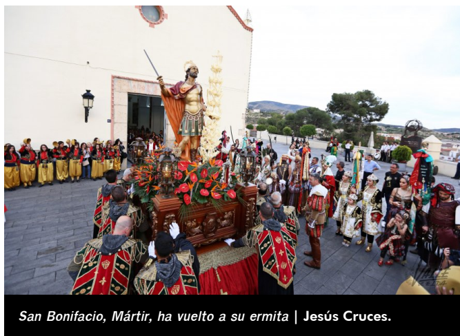
San Bonifacio, Mártir, ha vuelto a su ermita | Jesús Cruces.

Ya con el santo presidiendo el altar llegó la Proclamación de los cargos de 2018 en una abarrotada parroquia . Este momento supone el fin de unas fiestas y el inicio de las próximas , se inicia de nuevo la cuenta atrás para volver a disfrutar de estos días en los que la pólvora, la unión, la música y el color inundan las calles de Petrer. La jornada finalizó con la Bajada de cargos, acto en el que las comparsas ya desfilaron en el orden de 2018. Abrieron Marinos, seguidos de Tercio de Flandes, Estudiantes, Labradores y Vizcaínos por el bando cristiano; y en el bando de la media luna: Moros Beduinos, Moros Viejos, Berberiscos, Moros Fronterizos y Moros Nuevos.