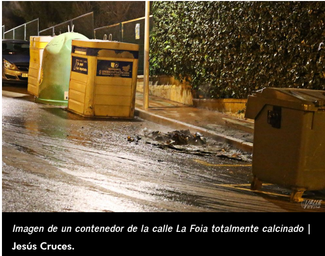
Imagen de un contenedor de la calle La Foia totalmente calcinado | Jesús Cruces.

encontraban todos a apenas unas calles de distancia, en el casco antiguo de la ciudad, y todos comenzaron a arder con pocos minutos de diferencia, por lo que todo apunta a que el culpable podría ser una o más personas coordinadas. En concreto se prendieron dos contenedores en la calle La Foia, dos en la vía Amazonas con Colombia y otra junto a la ermita de San Bonifacio, además se incendió un árbol junto a la calle Travesía del Santísimo Cristo.