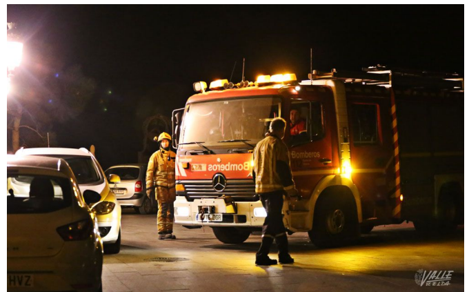
Un camión de bomberos acudió hasta la ermita de San Bonifacio | Jesús Cruces.

De forma paralela, ayer en torno a las 22 horas se produjo un accidente en la autovía A-31, en el término de Sax, en el que varias personas quedaron atrapadas y dos dotaciones del cuerpo de Bomberos tuvieron que acudir para socorrerlas.