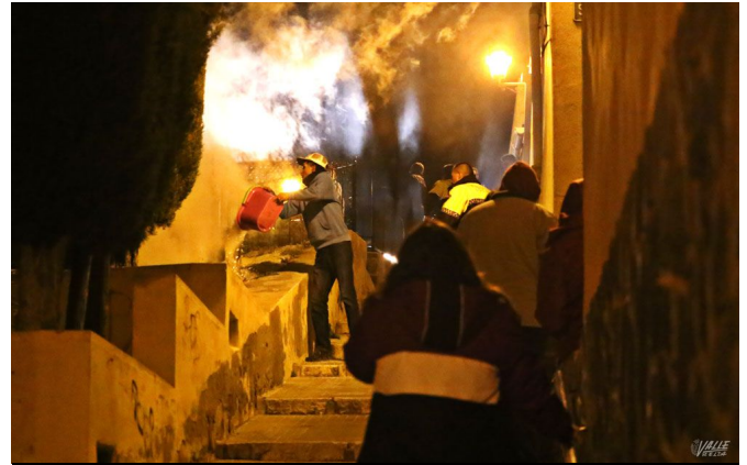
Los vecinos colaboraron en apagar uno de los fuegos | Jesús Cruces.

Los vecinos de la zona se mostraron disgustados ante estos actos vandálicos "con los que solo se buscan hacer daño", y es que fueron muchos los petrerenses los que salieron a la calle tras ser conscientes del fuerte olor a quemado y ver el humo en los alrededores del casco antiguo.