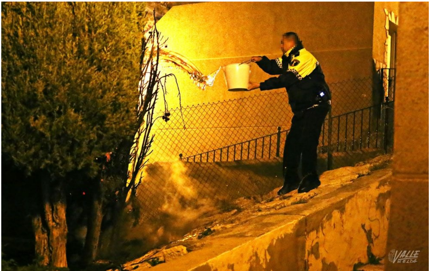
La Policía Local y un vecino lograron extinguir uno de los fuegos intencionados

Al menos cinco contenedores y un árbol ardieron ayer en Petrer en apenas una hora, entre las nueve y las diez de la noche aproximadamente. Al parecer una o más personas, por causas que se desconocen, decidieron provocar varios incendios con el único objetivo de hacer daño . El cuerpo comarcal de Bomberos y la Policía Local de Petrer se coordinaron a la perfección para poder realizar una rápida y efectiva actuación para apagar las llamas y evitar daños mayores.